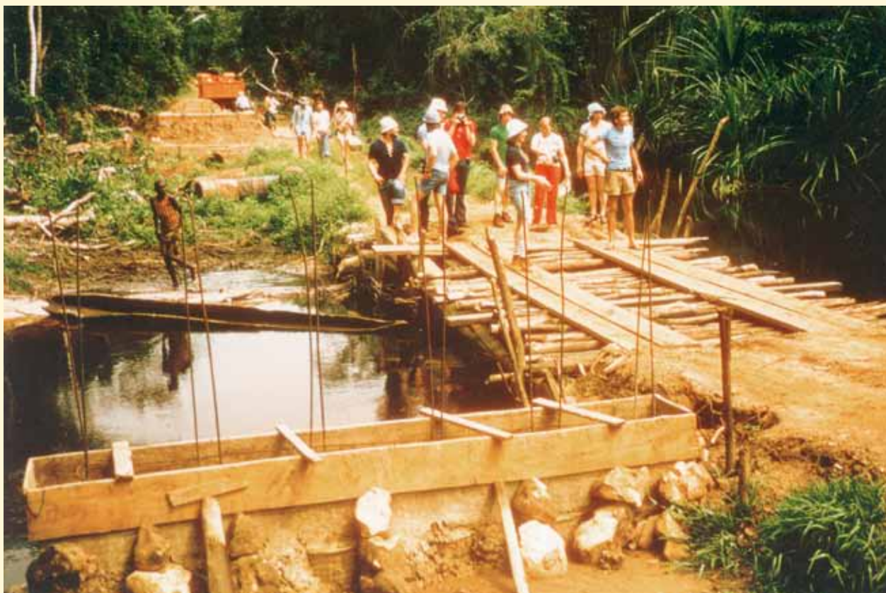
En 1977, une première délégation de jeunes Luxembourgeois se rendit au Congo pour se faire une idée du travail qui se réalisait sur place

Wat dëst u Liewensqualitéit fir d'Leit op der Plaz bedeit huet, dat konnt Chrëschttag 1977 eng Delegatioun vu 25 Jongen a Meedercher op der Plaz erliewen. Dës éischt Afrika-Expeditioun gouf duerno zur regelméissegger Tradition an huet aus ville jonke Lëtzebuerger iwwerzeachten Unhänger vum Prinzip vun der „Hilfe zur Selbsthilfe“ gemaach.