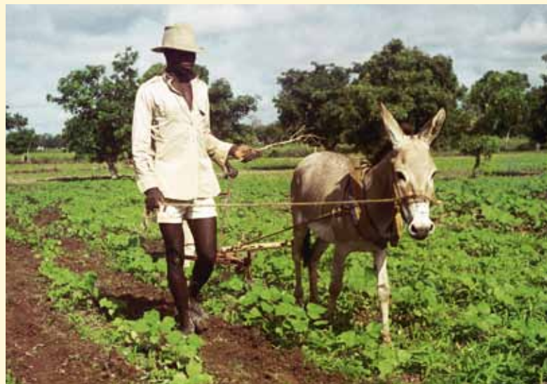
Binage à la traction asine