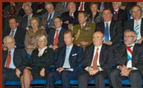
La séance académique a été rehaussée par la présence d'un grand nombre d'invités d'honneur