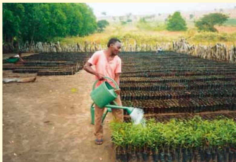
L'accent de la formation à N'sele-Mwedi fut mis sur l'agro-foresterie