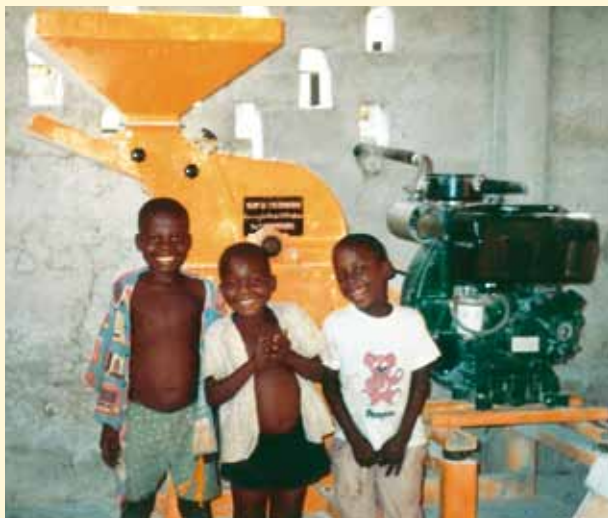
Installation de moulins à manioc à Djuma et à Sia en RDC