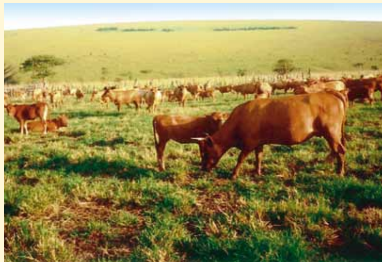
L'élevage du gros bétail allait garantir une certaine auto-suffisance aux CFRs de Lwono et de N'sele-Mwedi

Grouss Déngschter konnten de Schwëstere vu Fatundu fir hir Aarbecht am Interessi vun der lokaler Bevëlkerung entgéintbruecht ginn. Dës gutt Zesummenaarbecht war d'Basis fir eng weider spéider Kooperatioun tëscht der ONG LJB&JW-SC an de Communautéite vun de Soeurs de Sainte-Marie de Namur an de Joeren 1997 bis 2007 am Cameroun, Congo a Rwanda.