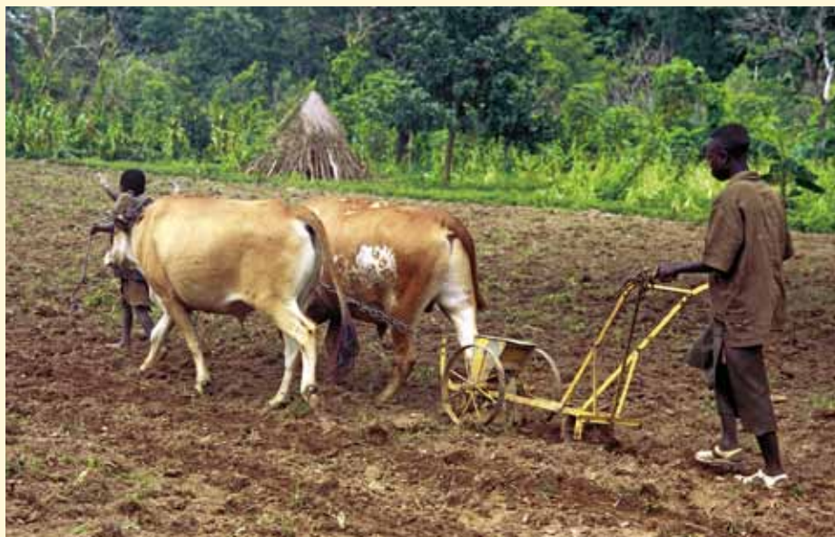
Grâce à la traction bovine, les conditions de travail des jeunes fermiers ont pu être améliorées

Zum feste Bestanddeel vun der Formatioun huet och d'Schaff mat den Ochse gehéiert. D'Plouen an d'Uséie vun de Stécker mat dem Ochsegespann an och den Transport vun der Rekolt hunn zu enger massiver Erliichterung vun der Aarbecht vum Bauer a senger Famillje bäigedroen. Déi forméiert an installéiert Huefmänner kruten dofir dat néidegt Material vum Zentrum zur Verfügung gestallt, dat si da spéider lues a lues ofbezuelen hunn. An de gutt agerichteten Ateliere vum Zentrum konnt eng Rei vun dësem Material produzéiert ginn.