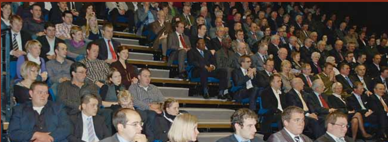
Beaucoup de jeunes membres étaient présents à la séance académique. Dans son allocution de bienvenue, le président de l'ONG a souligné que l'action au développement a toujours été portée par les jeunes du monde rural luxembourgeois