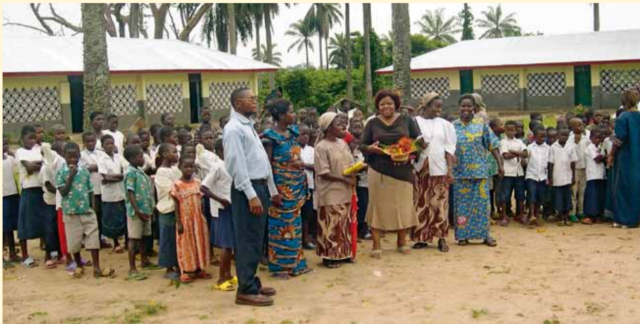
De grands travaux de rénovation et d'extension étaient devenus nécessaires afin de garantir la continuité des cours dans les écoles de Djuma et de Sia