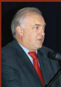
Monsieur Charles Goerens, Député au Parlement européen