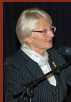
Madame Marie-Josée Jacobs, Ministre de la Coopération et de l'Action humanitaire