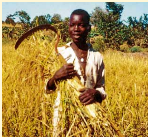
Un champ labouré à la traction asine, semé en lignes, biné et butté, donnait des récoltes deux à trois fois supérieures à la moyenne