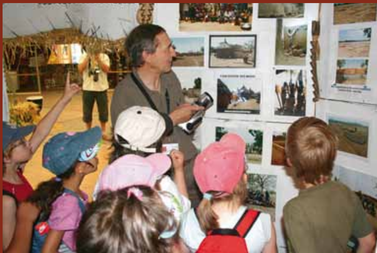
Initiation à la coopération au développement des classes scolaires par le spécialiste en la matière...