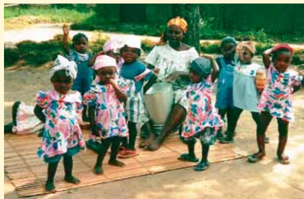
Aide au Centre nutritionnel de Ruyenzi au Rwanda