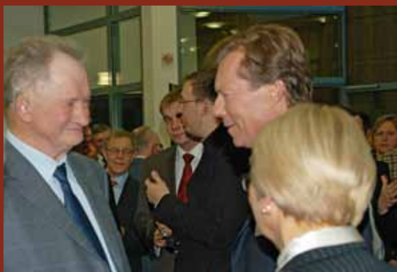
Le Grand-Duc Henri en conversation avec Monsieur Antoine Mailliet, premier volontaire des LJB&JW, lors du vin d'honneur offert par la Commune de Mersch