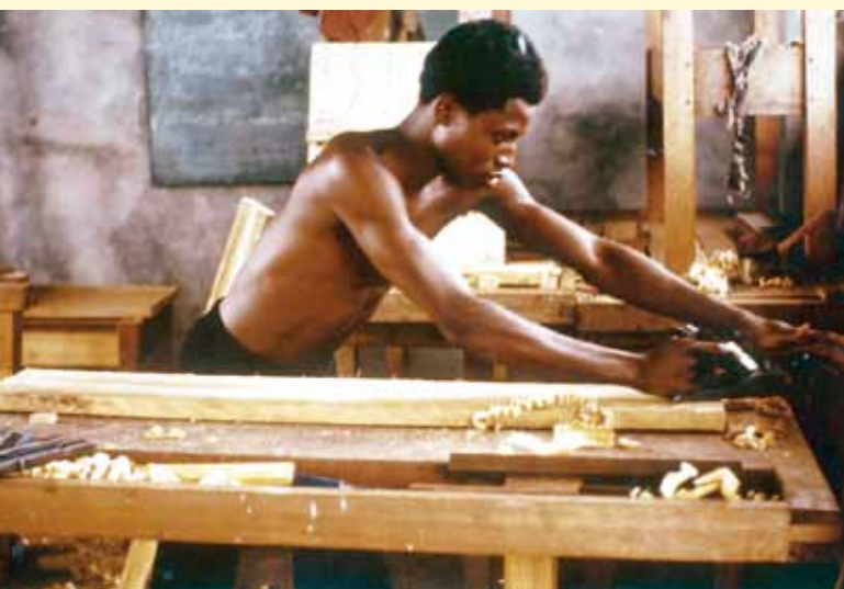
La formation de menuisiers faisait partie des activités liées à l'encadrement des jeunes de la région