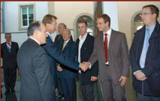
Accueil de S.A.R le Grand-Duc Henri par les autorités politiques et les présidents des associations LLJ – JB&JW