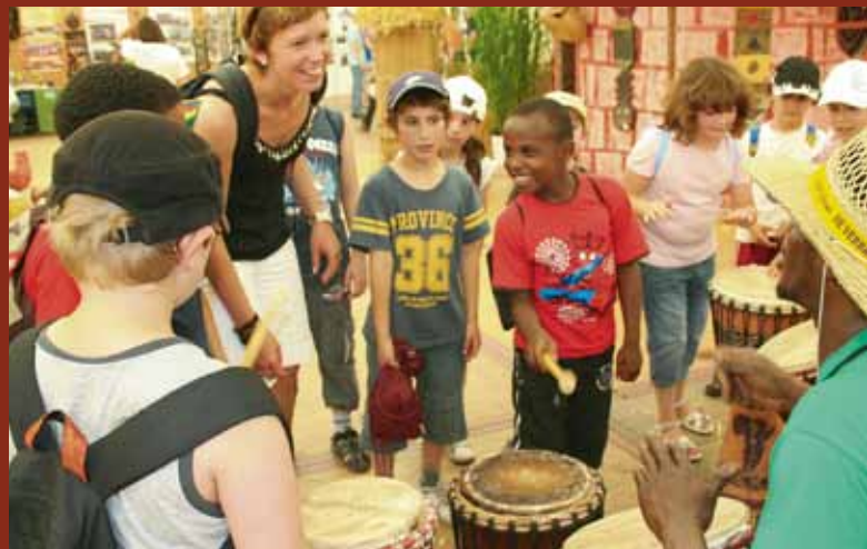
... et initiation au djembé des enfants par les animateurs africains de l'Agence culturelle de l'ASTM et de l'Agence interculturelle de l'ASTI