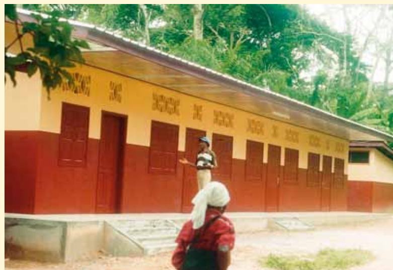
Extension du Centre de santé à Zoétélé au Cameroun