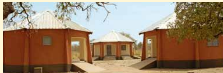
Une grande partie des constructions prévues a pu être réalisée

Mir sinn der Iwwerzeugung, datt dësen innovative Kooperationsprojet, deem d'Lëtzebuurger Jongbaueren a Jongwënzer an Zesummenaarbecht mam Lëtzebuurger Kooperatiounsministär an der lokaler Partnerorganisatioun Les Mains Unies du Sahel verwickelen, den Intressenten a Beneficiairen um Terrain den néidegen Knowhow bréngt an d'Objektiver ëmgësat ginn. Deemno wäerten och nach 50 Joer nodeem datt d'Entwécklungszesummenaarbecht vun de Lëtzebuurger Jongbaueren a Jongwënzer – ënnert dem Motto Kampf géint den Hunger an der Welt – ugefaangen huet, weider Zeeche vu Solidaritéit mat der männerbemëttelter Landbevëlkerung an Afrika gesat kënnen ginn.