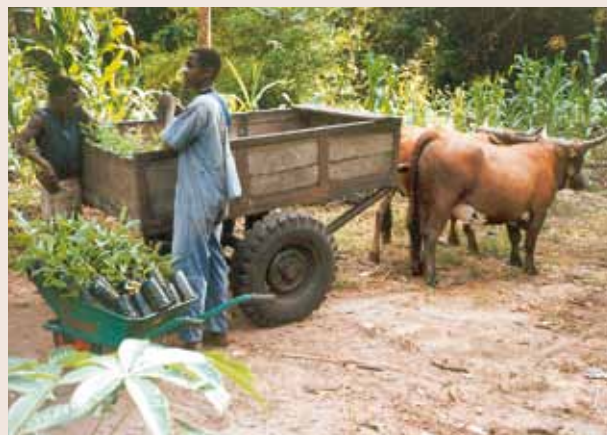
La traction bovine au service des pépiniéristes

De grands services furent rendus aux Soeurs des communautés citées dans l'intérêt de la population locale. Cette collaboration allait constituer ainsi la base d'une intense coopération entre les SSMN et l'ONG Lëtzebuurger Jongbaueren a Jongwënzer – Service Coopération (JB&JW-SC) dans l'intérêt des communautés du Congo, du Rwanda et du Cameroun durant les années 1997 – 2007.