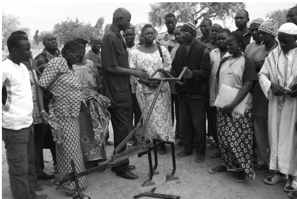
Die Kassin wird den Bauern anlässlich eines Lehrgangs in den Dörfern vorgeführt

Am Anfang dieser Regenzeit verpflichtete das CTAA fünf Landwirte, die mit Hilfe