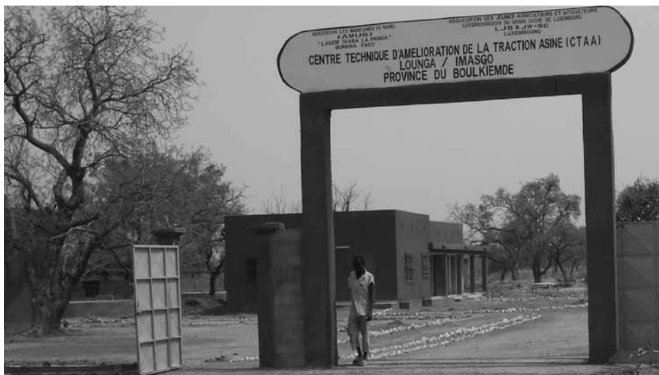
Das CTAA soll sich in der Zukunft zu einem Referenzzentrum für die Haltung und den optimierten Einsatz von Eseln in der Landwirtschaft entwickeln

Frankreich sowie vor Ort in Burkina Faso eingeführt worden waren, konnten die ersten 70 Bauern der ins Projekt eingebundenen Dörfer Sabouna, Koalma, Tiogo und Imasgo in Einheiten von je einer Woche ausgebildet werden. 20 Frauen und 50 Männer nahmen an diesen Lehrgängen teil.