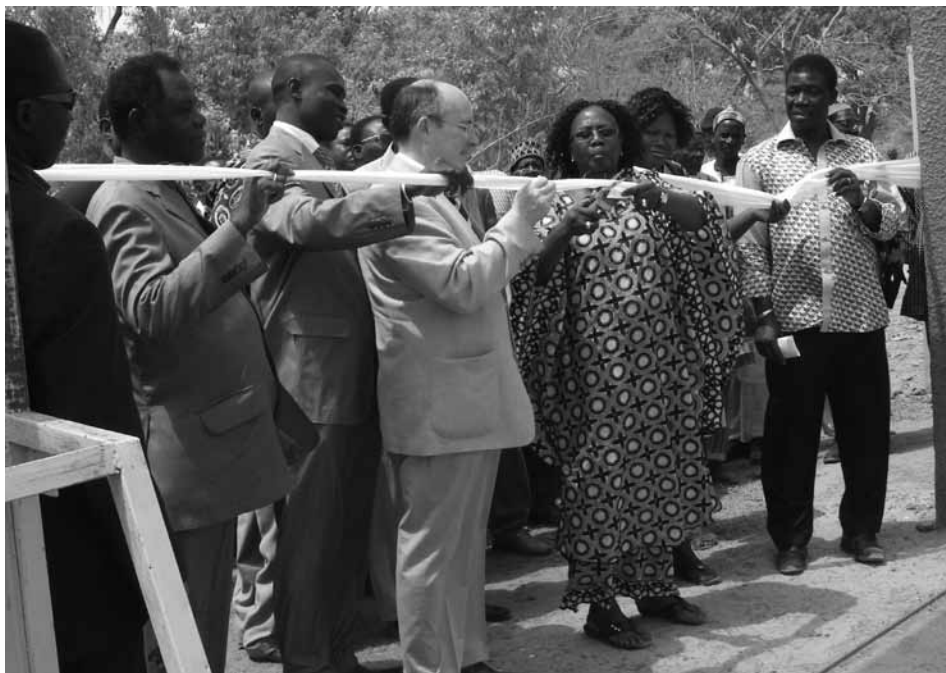
Mit der Durchtrennung des traditionellen Bandes konnte das CTAA seinen Bestimmungen übergeben werden

fiques pour nous rassurer de l'impacte notable du travail des volontaires luxembourgeois et pour nous stimuler à renouer avec l'action du passé pour le prolonger.