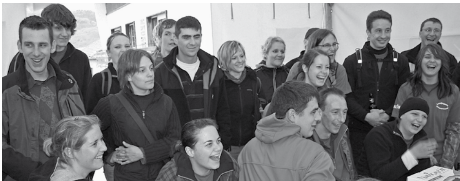
Wësse, Geschéck, Zesummenhalt, Ausdauer, ... a vill Amusement, waren op der 36. Editioun vum Landjugenddag ugesot

Mir hunn den Dag mat enger feierlecher Mass ugefaang, de Mëtte steet, wéi gewinnt e Rallye mat flotte Spiller an engem kniwwelege Froebou um Programm. Deenen, déi do net „mathale“ kënnen, bidde