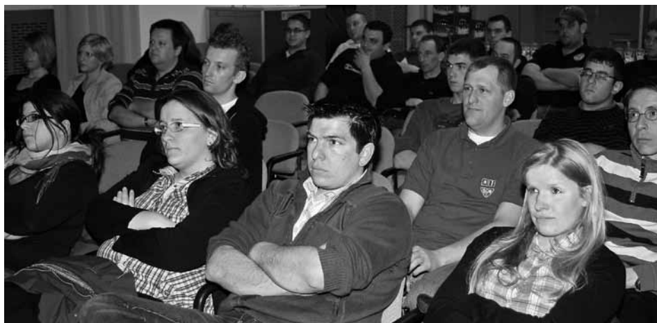
E Bléck an de Festsall vum LJA während de Generalversammlungen vun eisen Associatiounen, den 9. Abrëll 2010