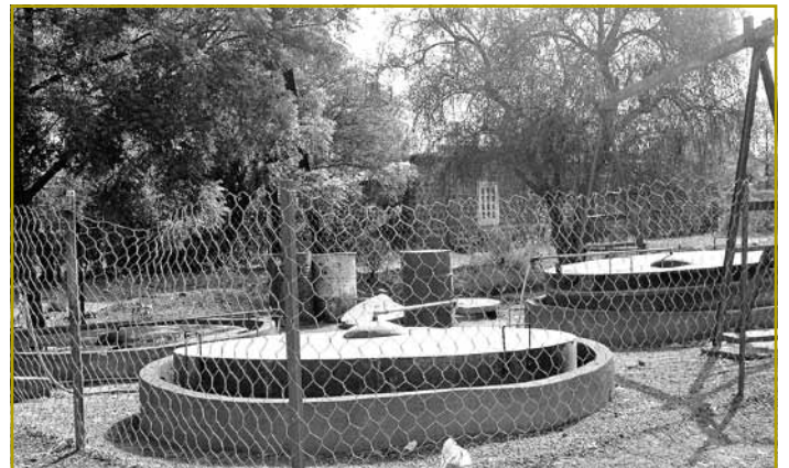
Leider besteht weiterhin Handlungsbedarf, bevor die Anlage ihren Bestimmungen gerecht werden kann

in Burkina Faso und dem Lycée Technique Agricole aus Ettelbrück (LTA) gepflegt. In regelmäßigen Abständen werden sogenannte Kooperationsreisen von den Verantwortlichen des LTA organisiert, um es interessierten Schülern und Professoren zu ermöglichen, sich mit den Gegebenheiten in verschiedenen Regionen Afrikas vertraut zu machen. Der direkte Kontakt sowie konkrete Arbeiten im Interesse der Partnerschule in Ouahigouya standen in den letzten Jahren immer wieder auf dem Programm der Sensibilisierungstouren. Infolge der regelmäßigen Besuche wurde im November 2004 der Bau einer Biogasanlage auf dem Gelände des Gymnasiums YADEGA ins Auge gefasst. Nach intensiven Vorbereitungsmaßnahmen und der darauf folgenden konkreten Umsetzung konnte die Anlage Anfang 2010 größtenteils fertig gestellt werden.