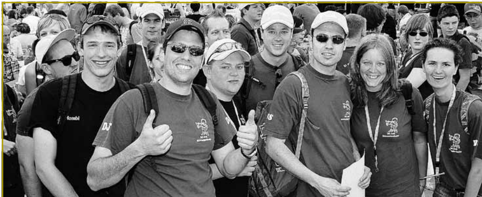
196 Gruppen hunn sech bei beschter Stëmmung op den 10 km laange Ralley ronderëm Wäiswampech gemaach ...

No Elwen (1975), Cliärref (1981), Hengischt (1988), Wentger (1996) a Cliärref (2004) hat et