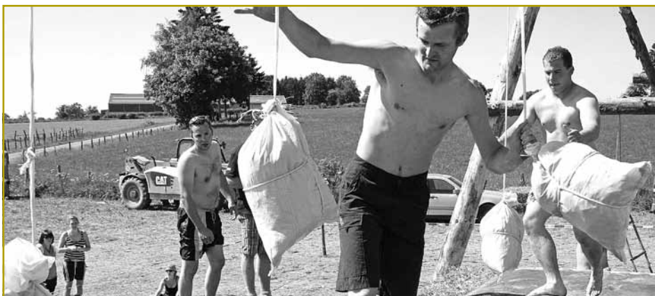
... wou esou munch Iwwerraschung op si gewaart huet

eis la an d'Gemeng Wäiswampich verschloen. Sumatt ass de Cliärrefer Grupp fir di 6. Kéier dran, fir de Landjugenddag ze organiséieren.