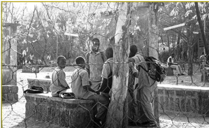
Rund 2.700 Schüler sind im Gymnasium YADEGA in Ouahigouya eingeschrieben