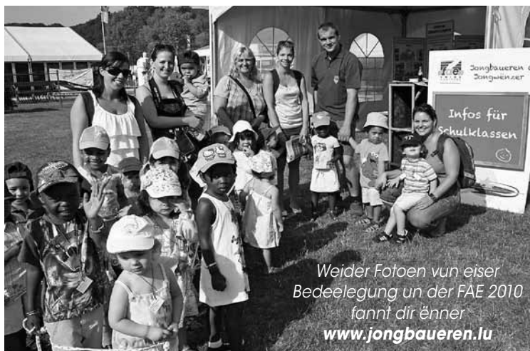
Weider Fotoen vun eiser Bedeelegung un der FAE 2010 fannt dir ënner www.jongbaueren.lu

Zu den Aufgaben vun der LLJ – JB&JW zielt den Encadrement vun de Kanner aus de Spillschoul- a Grondschoouklasse aus dem Land. D'Memberen vun der LLJ – JB&JW hunn dëst Joer deemno och d'Aschreiwungen an den Accueil vun de Schouklasse assuréiert, déi sech am Kader vun der Aktioun „Sou schmaacht Lëtzebuerg“ un engem Pechbiller-Concours vun der Chambre d'Agriculture bedeelegt hunn. Iwwer dëse Wee konnt de Kanner d'Landwirtschaft, de ländleche Raum an d'Natur mat allen Diversitéite vermëttelt ginn.