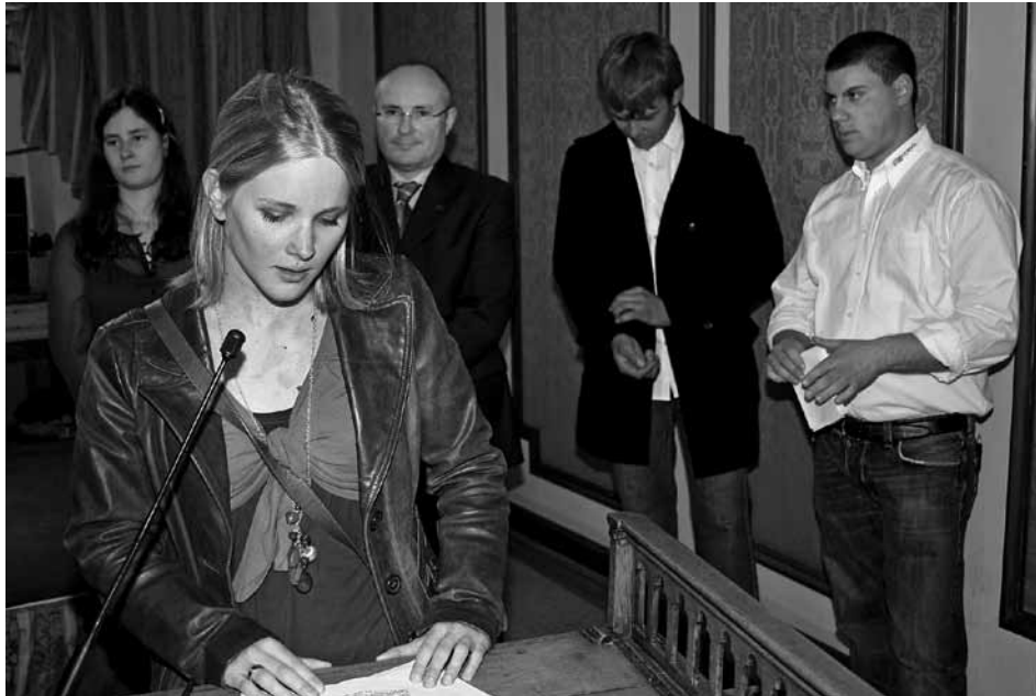
Fir déi nei Presidentin stellen d'Responsabilitéiten, déi Jonker an de Verbänn iwwerdroe kréien, e wichteg Mëttel an der Entwécklung zum verantwortungsvollen Erwuessenen duer

Éischt Usprooch vun der neier National-Präsidentin vun der Lëtzebuerger Landjugend um Éierewäin an der Gemeng Ettelbréck