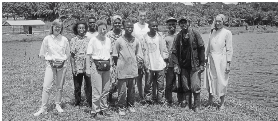
Un groupe de membres de notre ONG en visite au Cameroun en 1999

Étant responsable des communautés des SSMN au Congo, je suis passée plusieurs fois à Lwono lors de mes visites de différentes missions et notamment en revenant de Kinshasa. Chaque fois j'étais frappée par les arbres fruitiers et petits bosquets d'arbres qu'ils avaient réussi à faire pousser dans la savane. Les pâturages des troupeaux étaient très étendus car le sol était extrêmement pauvre et l'eau était rare. L'infrastructure du Centre de formation est restée simple et les bâtiments étaient conçus de façon pour que les stagiaires puissent reproduire le modèle dans leur village. L'action au développement s'étendait sur toute la région, fort peu peuplée. C'est ainsi que le Père Ekkelboom tout comme François Glodt, le successeur de Camille, étaient régulièrement de passage à Kingala où les Sœurs de Sainte Marie entretenaient un dispensaire. Pour moi, je voyais que le Centre était parfaitement adapté au milieu. Toutefois, les grandes distances vers les centres urbains et l'état des routes constituaient un grand handicap au développement de ce Centre.