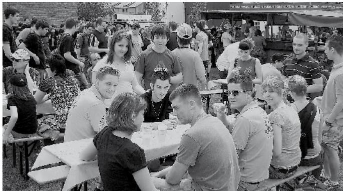
Virun an am Centre Camille Ney ass et an der Tëschenzäit schonn héich hirgaang, éier déi éischt vun deenen insgesamt 160 Gruppen sech op de Rallye gemaach hunn