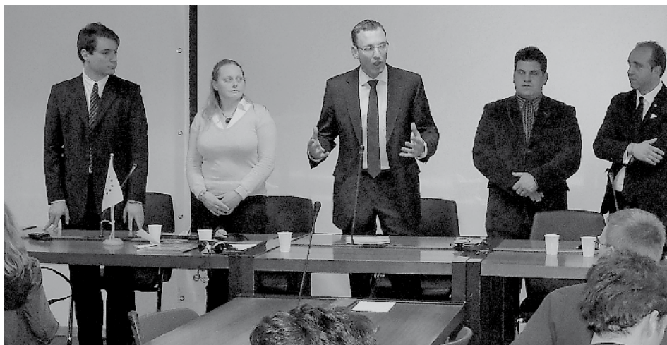
Blick auf den Vorstandstisch des CEJA

Am 31. März fand im COPA-Gebäude in Brüssel die diesjährige CEJA-Generalversammlung statt. Hier konnte auf das sehr erfolgreiche Jahr 2008 der europäischen Jungbauernorganisation zurückgeblückt werden. Des Weiteren stand die Generalversammlung im Zeichen der Wahl des neuen Vorsitzes des CEJA.