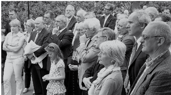
Niewent der aussergewöhnlech viller Prominenz, déi um Eierwäin gezielt konnt ginn ...