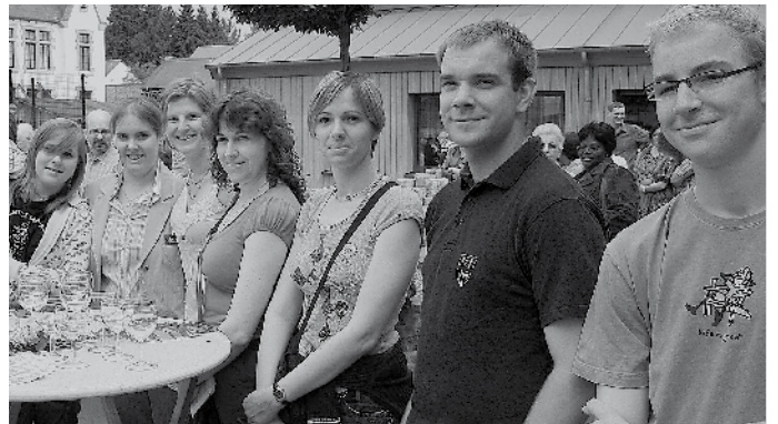
... waren och vill bekannte Gesichter aus eisen eegene Reien präsent