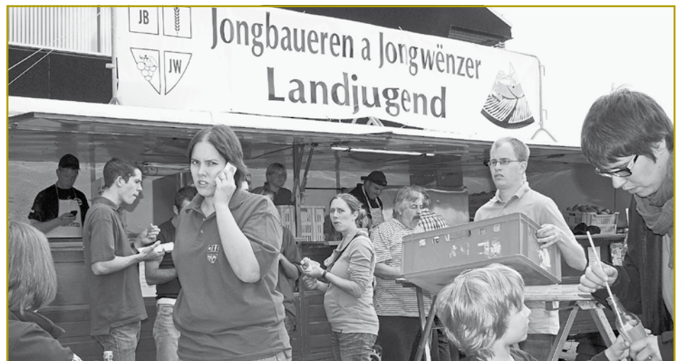
Niewent dem Encadrement vun de Schoulkanner war vill Organisatiounstalent vun de Memberen aus dem Aarbechtsgrupp FAE gefuerdert

Bill: De Kaarschnatz ass dee Moment wou gedresch gëtt. Dat, wat een am Moment giel op de Felder gesäit ass Geescht.