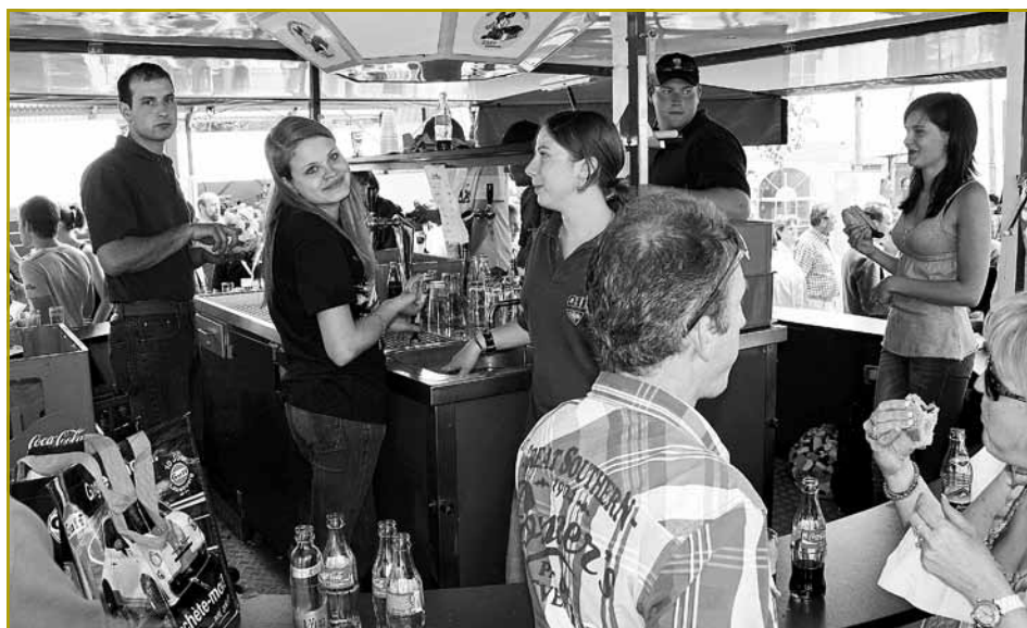
Um less- a Gedrénksstand hunn déi Jonk aus eise regionale Gruppen duerfir gesuergt, datt kee vun de Visiteuren hongreg oder duschtreg heem gaangen ass