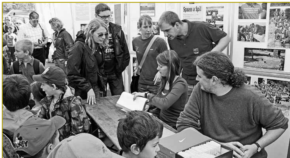
Vollen Asaz gouf dee ganzen Dag iwwer vun de Membere vun der LLJ an de LJB&JW verlaangt – beim Accueil ...