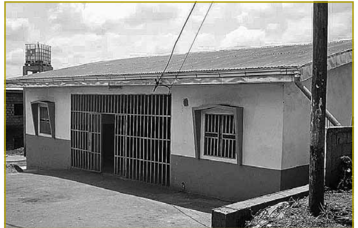
Die Krankenstation in Soa verfügt nunmehr über fließendes Wasser und Elektrizität