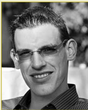
Lëtzebuurger Jongbaueren a Jongwënzer