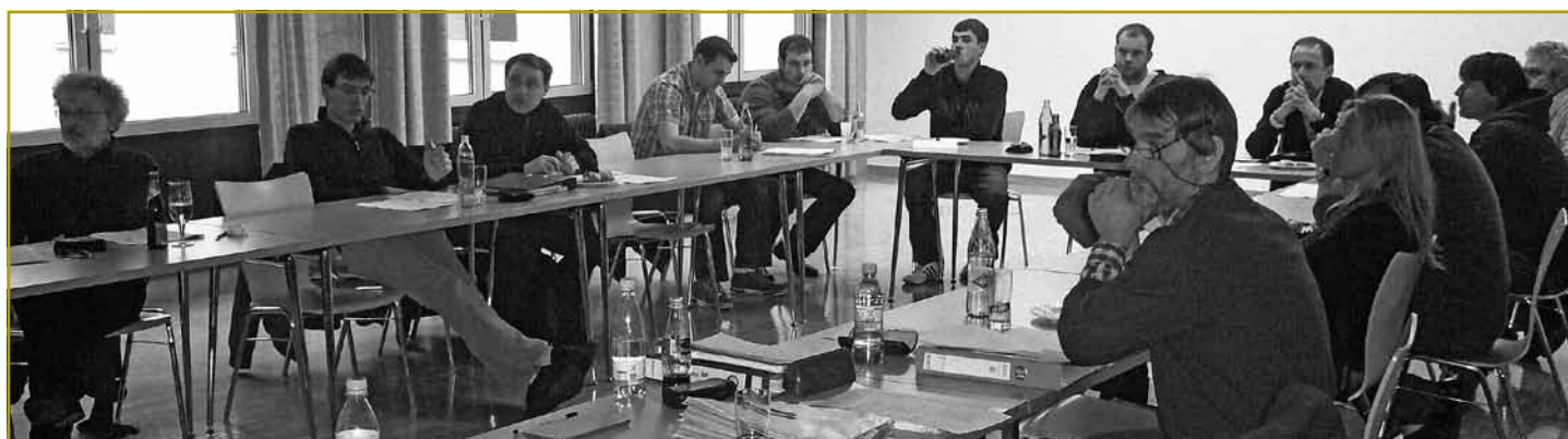
In zahlreichen Versammlungen und Workshops wurden gemeinsame Positionen herausgefiltert und definiert