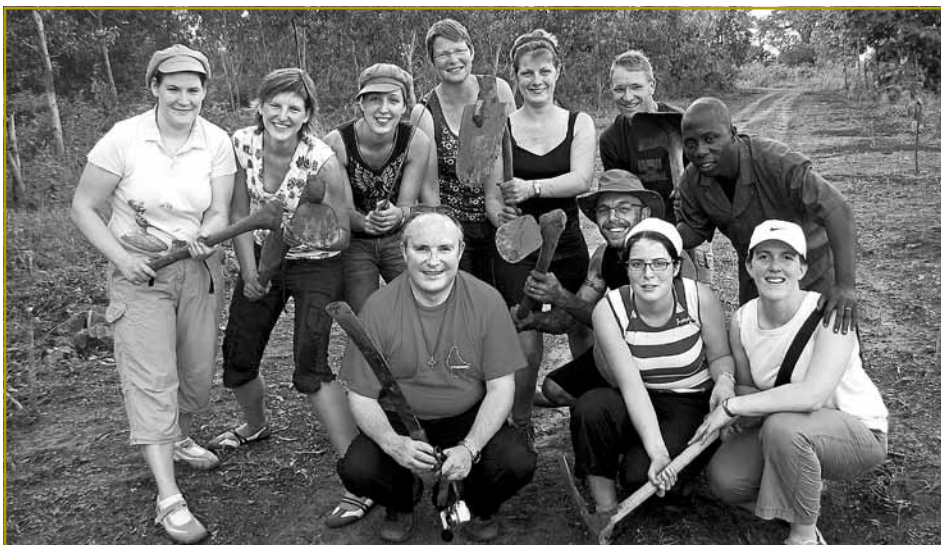
Während enger Visite vun engem vun eise Kooperatiounsprojeten am Bénin a Begleedung vu jonke Memberen vun eise Verbänn