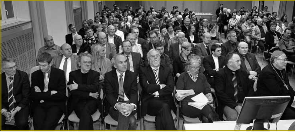
Grouss war den Intressi un der Thematik vum dësjäreg Jongbaueren- a Jongwënzerdag bei de Vertrieder aus der nationaler a kommunaler Politik, den Akteuren aus der Landwirtschaft an der Oekologie a ville jonke Frënn a Memberen vun de LJB&JW