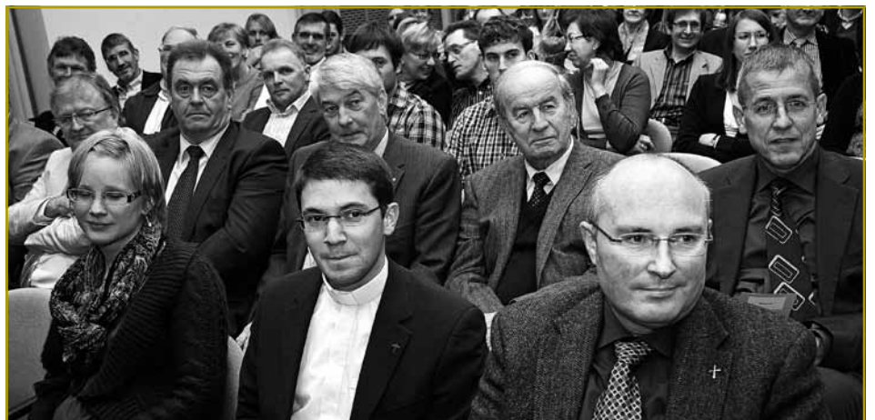
... an huet den ugekënnegte Wiessel um Niveau vun der Aumônerie vun der LLJ - JB&JW bestätegt

An deem Sënn wënschen ech lech alles Guddes. Ech si virun allem hei fir ze léieren an ech freeë mech och dorop. Villmols Merci!