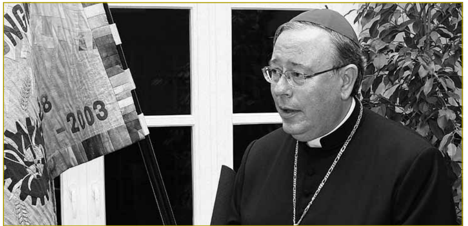
Den Här Äerzbëschof Jean-Claude Hollerich huet de Jongbaueren- a Jongwënzerdag a säin Agenda opgeholl...

Dir sidd an deem Sënn wichteg - och well Dir äis an d'Gediechtnes rufft, wee mir eigentlech sinn a vu wou mir kommen. A wien dat vergësst an d'Nues héich dréit, dee fällt gären op de Mond.