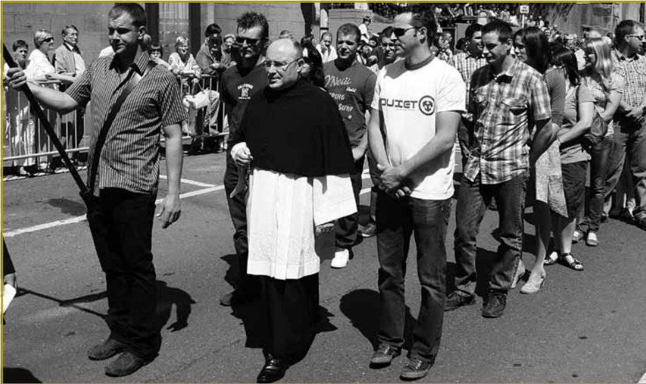
An der Schlusspréssessioun mat der LLJ an de LJB&JW

esou beschriwwen: „Op den Aumônier leeft villes zou a vun him geet villes aus. Hien huet d'Méiglechkeet fir Kontakter ze kneppen. Heiandsdo verspiert en och Drock an esouguer Frust, well dat Administrativt erschléit. Dat Spezifesch beim Aumônier vun de Jongbaueren a Jongwënzer ass nämlech, datt hie quasi eng Zort ‚Permanent‘ ass – mat Sekretärsaarbecht a Verwaltung vun der Keess, als Zeitungsredakter, President vun der ONG, éischte