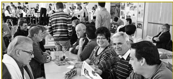
Déi Intresséiert konnten sech de ganzen Nomëtteg iwwer d’Aarbecht vun der ONG informéieren ...