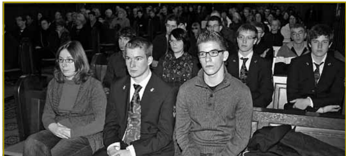
Den Dag zu Gonschte vun der Entwécklungszesummenaarbecht an Afrika vun der ONG Lëtzebuerger Jongbauere a Jongwënzer – Service Coopération a.s.b.l. gouf mat enger Mass zum Thema „Zwee Gesichter – ee Wee“ an der Porkierch vu Rouspert ageleet

E Sonndeg, den 23. Oktober 2011 huet déi regional Landjugendgrupp Maacher op deem traditionellen Dag vun der Kooperatioun op Rouspert, resp. Steenem, agelueden. Well mir aus Plazgrënn an deene béid leschten Ausgabe vum „Lëtzebuerger Duerf“ net op dës flott Initiativ vun der Landjugend agoe konnten, wëlle mir dat heimat nohuelen. All deenen, déi sech am Virfeld an den Dag iwwer fir déi gutt Saach agesat hunn, dréckt de Verwaltungsrot vun der ONG säi ganz grouse Merci aus!