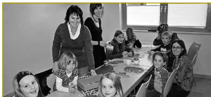
Ënner der Leedung vu sympathesche jonken Dammen konnten d’Kanner hir Kreativitéit beim Bastele vun afrikanesche Masken ënner Bewäiss stellen

Vill Informatiounen zu der Kooperatiounsarbecht vun der ONG a weider Fotoen vum Dag fënnt een ënner www.jongbauere.lu