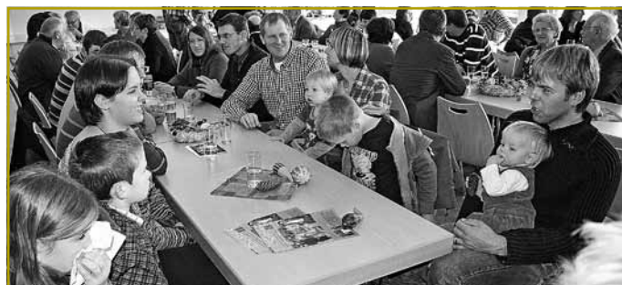
Präsenz vu de Memberen aus anere regionale Landjugendgruppen huet déi „Maacher“ an hirem Engagement fir déi gutt Saach encouragéiert