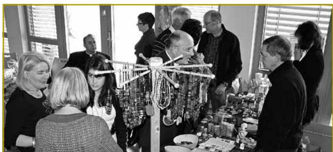
Op de Stänn vun de Welt-Buttëcker a vu Partage Afrique sinn afrikanesch Produiten a Konschtgéigestänn ugebuede ginn