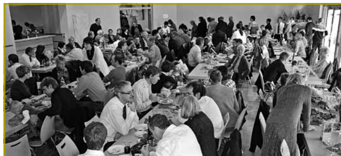
... an e puer flott Stonnen a sympathescher Gesellschaft verbréngen