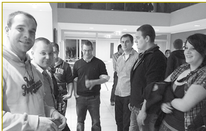
Ronn 35 Vertrieder aus de regionale Gruppen hunn sech de Patt net entgoe gelooss