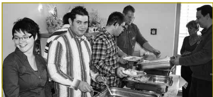
No der Mass hunn si fir d’Wuel vun hiren Invitéen am Centre polyvalent „Fräihof“ zu Steenem gesuergt