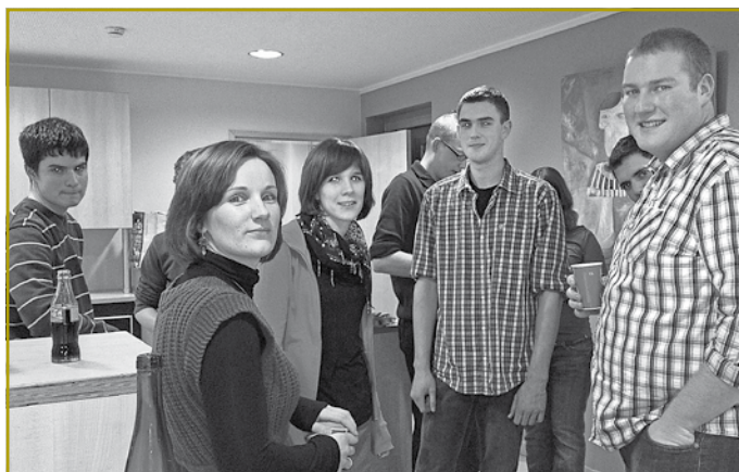
Eng staark Equipe war bei der LLJ Maacher um Dill fir hir Frënn ze empfänken

Lëtzebuerger Landjugend – Jongbauere a Jongwënzer