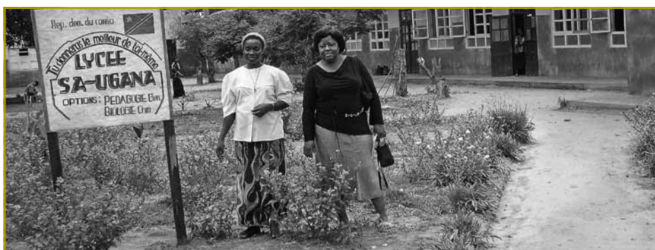
Somit sollen unter anderen auch diese Gebäude, die nicht von den Sanierungsmaßnahmen in den Jahren 2005 - 2007 betroffen waren, gründlich überholt werden

Nach der Zustimmung seitens des zuständigen Ministeriums wurde dem Träger eine erste Rate in Höhe von 100.000 € für die Anfangsphase des Projektes zugestellt.