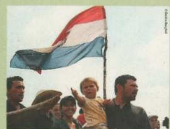
Demonstranten aus dem Film „Raising Resistance“