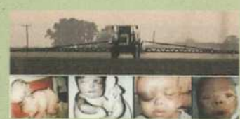
Krankheiten verursacht durch Pflanzenschutzmittel