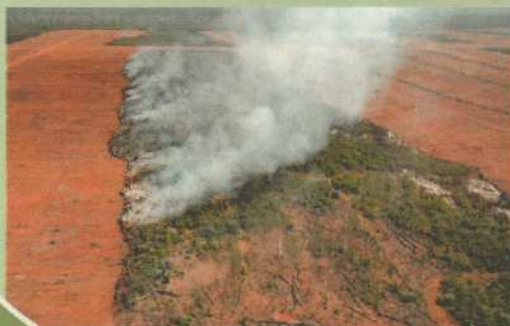
Regenwaldrodung zur Gewinnung von Sojaanbaufläche

„Produktion auf Kosten von Mensch & Natur.“