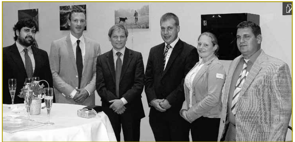
Der CEJA-Vorstand trifft EU-Agrarkommissar Dacian Cioloș