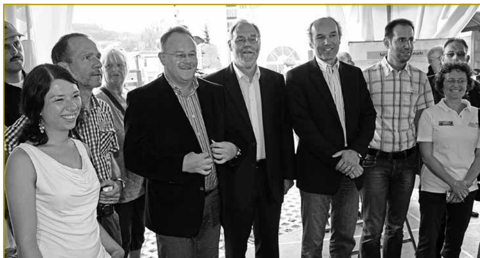
Déi zoustänneg Ministeren hunn sech et net entgoe gelooss fir beim 25. Anniversaire vun der ekologescher Landwirtschaftsberodung präsent ze sinn