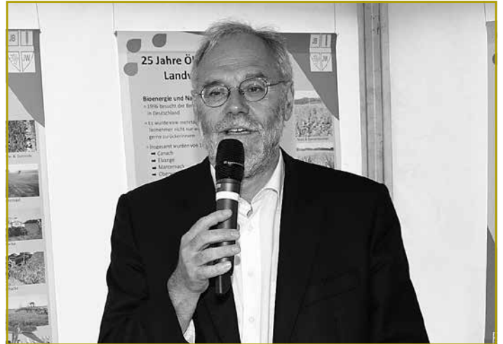
Anlässlich des 25. Jubiläums der ökologischen Landwirtschaftsberatung begrüßten die Minister Romain Schneider und Marco Schanck die weitere gemeinsame Initiative der LJB&JW und des Oeko-Zenter Lëtzebuerg im Hinblick auf eine nachhaltige Landwirtschaft in Luxemburg

am Sonntag (1. Juli) wurden vergangene und laufende Projekte, ehemalige und aktuelle Berater sowie politische, Naturschutz- und landwirtschaftliche Vertreter zusammengeführt. Das Resümee; Die Herausforderung der Gegenwart ist es zukünftig die erfolgreiche Zusammenarbeit aller Interessensgemeinschaften weiterzuführen, mit dem Ziel eine nachhaltige Landwirtschaft in Luxemburg zu etablieren. Neben einer kompetenten Beratungsoffensive zählen hierzu vor allem innovative Pilotprojekte, wie der