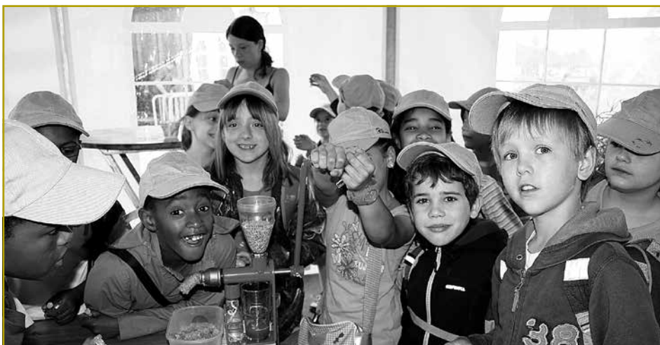
Begeisterte Schulkinder an der Ölpresse auf dem Messestand

Bildern verdeutlicht. Nach der Weltkarte ging es zu einem Poster, das zeigte welche Folgen der Sojaanbau in Südamerika hat. Neben der Regenwaldrodung zwecks Gewinnung von Sojaanbaufläche, den Entseignungen von Kleinbauern und der Pestizidbelastung wurde auch der Anbau gentechnisch manipulierter Sojapflanzen besprochen. Hierzu wurde auf dem Stand auch ein Film: „Vergiftetes Land - Die Folgen des Sojaanbaus“ in Dauerschleife gezeigt: http://www.feedingfactoryfarms.org/index.php?id=49