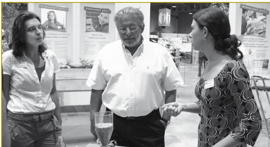
Auch Gesundheitsminister Mars Di Bartolomeo zeigte großes Interesse am Projekt