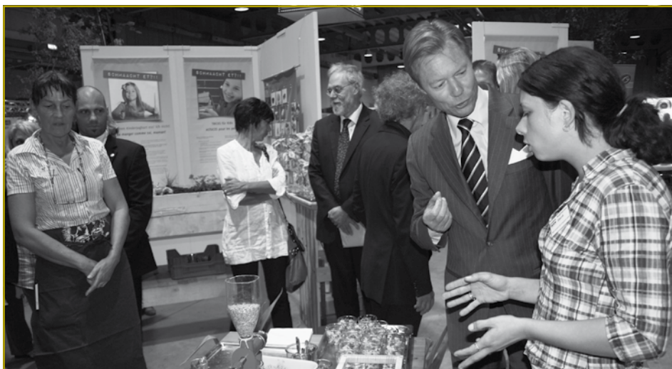
Hoher Besuch auf dem Stand der ökologischen Landwirtschaftsberatung des „OekoZenter Pafendall“ und der LJB&JW. Der interessierte Großherzog erkundigte sich über die gemeinsame Initiative im Hinblick auf eine nachhaltige Landwirtschaft in Luxemburg