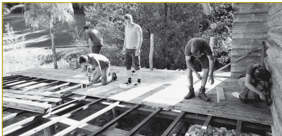
Déi nei Equipe vun der Landjugend Dikkrich huet gewisse wat se drop huet. Mat vill Enthusiasmus huet si sech den Erausforderungen vun der Aktioun gestallt