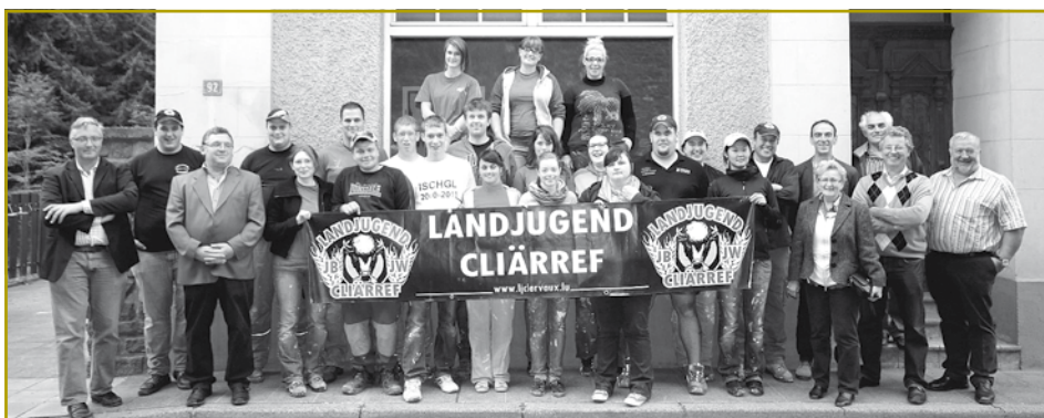
Fir d'Landjugend Cliärref ass de Benevolat keen eidelt Wuert. No hirer Landjugend-Power-Aktioun waren si dee Weekend drop fir de RESONORD am Asaz

De 15.-16. September war et dann un deene „Cliärwer“, déi sech an der Gemeng Eilwen engagéiert hunn. Hei hunn si de Pavillon frësch ugestrach. Dee Weekend dono gouf direkt nach eng Schëpp bäigeluecht an sech un engem Projet vu RESONORD zu Cliër bedee-