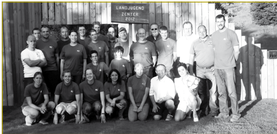
Och vun der Landjugend Zenter gouf villes gefuerdert. Si kënnen mat Stolz op déi geleeschten Aarbecht zrëckblécken

Féitz eng gréisser Aktioun vun de Verantwortleche vun der Gemeng Monnerech geplangt. Der Landjugend Uewersauer hir Aktioun gouf an d'Fréijoer 2013 verluecht. Si mussen deemno nach e bësse Gedold opweisen, éier d'Gemegeverantwortlech vu Wootz de Startschoss fir déi preparéiert Aarbechte ginn.