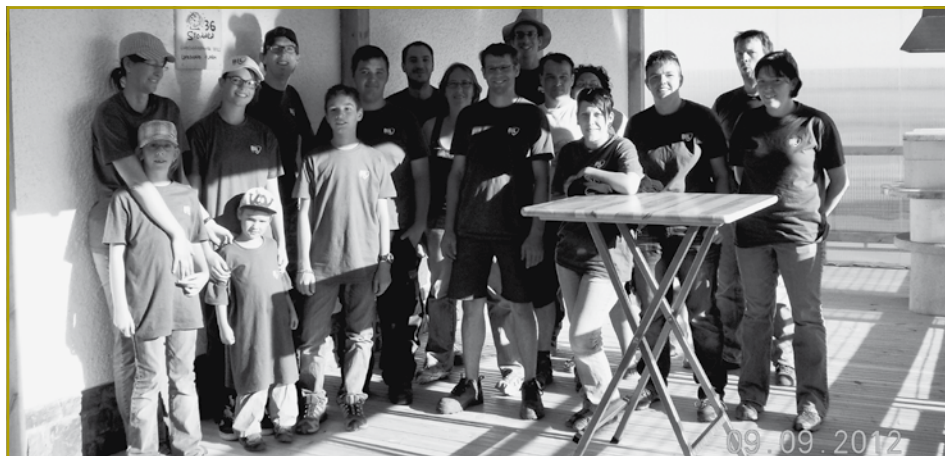
Eng weider staark Equipe war zu Duersch ugetrueden. No ville Stonnen Aarbecht konnt d'Landjugend Furen déi iwwerdeckte Grillplaz fir hir Bestëmmung fräi ginn