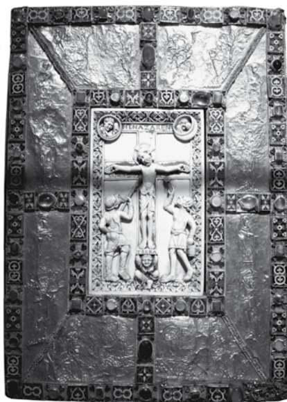
E wichtige Moment bei der Diakonewei ass d'Iwwerreeschung vum Evangeliar

Eisen Här Äerzbëschof huet e puer Mol be- tount, datt wa mer et net färdig brénge, jonk Mënschen duerch eise Glawen ze begeeschteren, datt hien dann de leschte Bëschof vu Lëtzebuerg wäert sinn. Mir hunn als Chrëschten eng Verpflichtung, d'Freet vum Glawen an der Welt ze liewen an ze verkënnegen. Als Chrëschten hu mer och eng weider Verpflichtung: Mir sollen dofir bieden, datt den Härgott eis jonk Männer schenkt, déi hien an den Déngscht vun de Mënsche beriff. D'Kierch brauch Geesch- tlech! An et ass wichteg fir eis Seminaristen ze bieden, datt se d'Kraaft hunn, d'ese won- nerschéine, awer net ëmmer einfache Wee ze goen.