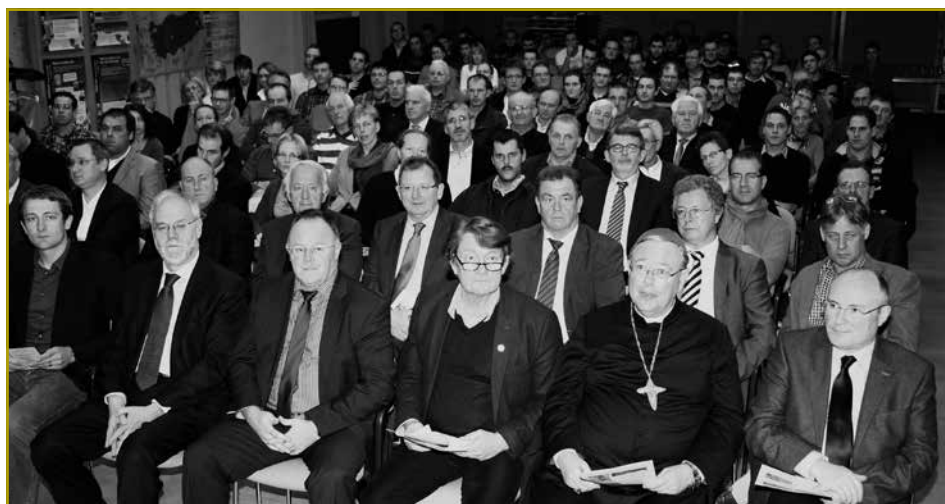
Op en Neits konnte vill Perséinlechkeeten an Akteuren aus der Landwirtschaft am Festsall vum LTA zu Etelbréck begréisst ginn. Vill weider Fotoen vum intressanten Owend fénnst een ënner www.jongbaueren.lu

Deeselwechte Phänomen gesäit ee bei der Ausgläichszoulag. Ech froe mech, firwat mir alles a Bewegung mussen setzen an Energie verschwenden, fir dass eist Land geophysikalisch benodeelegt bleift. Mir mussen eis