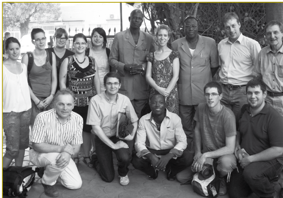
D'Delegatioun vun der „Lëtzebuurger Landjugend – Jongbaueren a Jongwënzer“ mat Vertieder vun der Partner-ONG AMUS, dem CTAA an der Lëtzebuurger Ambassade

Vertieder vun der „Lëtzebuurger Landjugend – Jongbaueren a Jongwënzer“ op Visite am Burkina Faso – vum 24. November bis 1. Dezember 2012