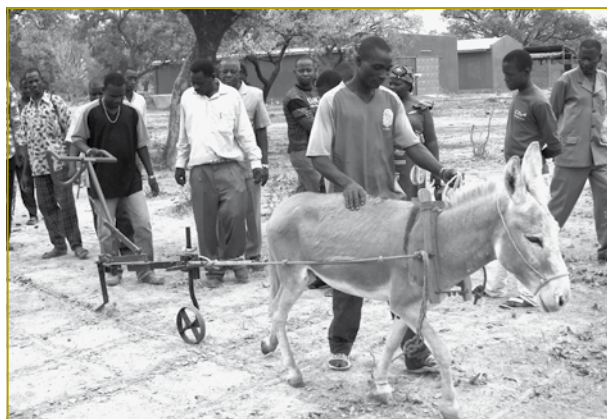
Mat dem richtegen Aarbechtsgeschir (lénks d'Kassin mat der Sous-Soleuse, riets de Kieler) an den optimiséierten Aarbechtmethoden kënnen d'Ertrag vun den einfache Baueren nowieslech verbessert ginn

Am Hibleck op d'Maximéierung vun den Erträg soll d'Aarbecht mat der Kassin fir vill Produzente vum Plateau central am Burkina Faso erméiglecht ginn.