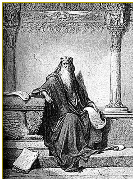
Ecclesiastes (der Prediger Salomo, Autor des Buches Kohelet)

Et kënnt ee vläicht esou guer soen d'Fähgkeet fir ze feieren erwiisst aus der Fähegkeet och ze kloen, ze trauern, d'Nout vun anere matzedroen. Ech mengen duerfir datt et keen Zoufall ass datt grad an der Bibel, virun allem an de Psalmen, Jubel, Luef, Hëllef an lenger ganz enk beienaner stinn an op déi krasst Aart a Weis ausgedreckt ginn. Op mir als Gemeinschaft, als