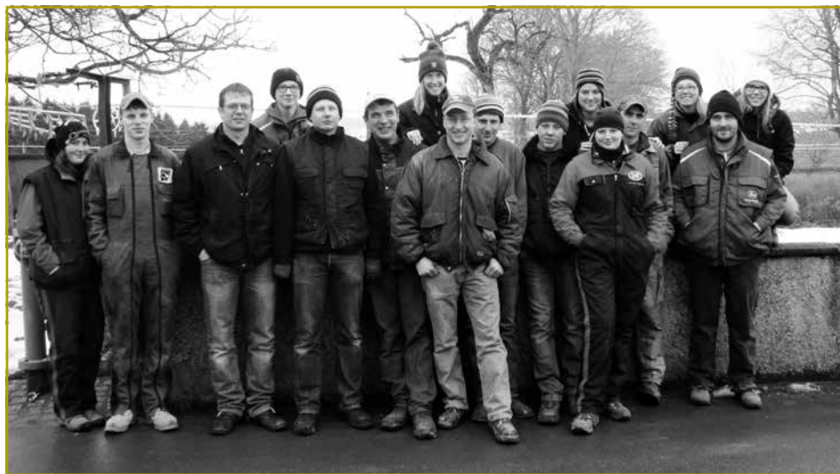
Si si bereet a freeën sech drop, fir d'Jugend aus dem Land geschwënn zu Näertrech ze begrüessen

Der Organisator des 39. Landjugendtages stellt sich vor