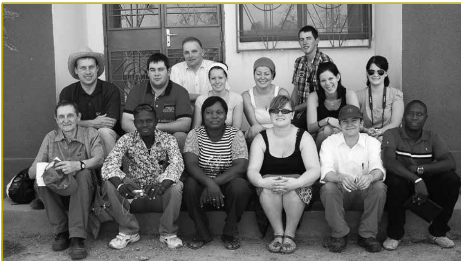
Die Gruppe mit den Verantwortlichen des CTAA