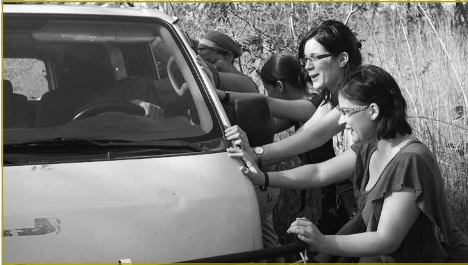
Nicht immer lief alles nach Plan. Jeder musste Hand anlegen als der Minibus im Sand stecken blieb