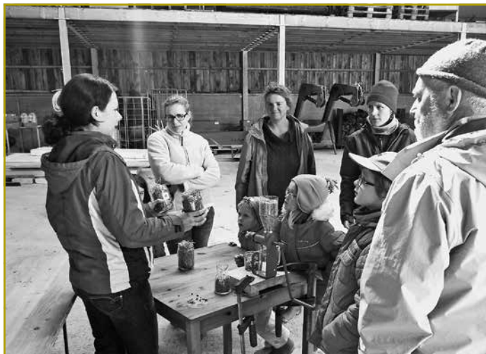
Die Landwirtschaftsberaterin ging ihrerseits auf den lokalen Ölfuchtanbau ein

die auf dem Kompost lagen, in dem sie gefunden wurde.