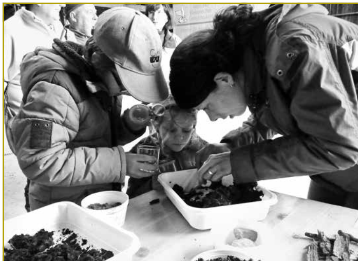
Alles was sich bewegt wurde genauestens von den Kindern in den Lupengläsern untersucht

Das Gemisch aus Lehm und Humus ergab einen fruchtbaren Boden auf dem heute Salat, Knoblauch, Kartoffeln, Radieschen, Tomaten, Kräuter und viele andere alte aber auch exotische Gartenkulturen angebaut werden. Gedüngt wird hauptsächlich mit Kompost. Daher ging es auch direkt zum nächsten Komposthaufen. Nach anfänglicher Skepsis gegenüber den Kriechtieren, insbesondere den Spinnen, griffen die Kinder beherzt zu, zogen Pflanzen aus dem Komposthaufen und schütteten die Erde in einen Eimer, um sie später zu untersuchen. Regenwürmer, Kellerasseln, Spinnen, Fruchtfliegen, Engerlinge und alles was sich sonst noch bewegt wurde in Lupengläser gepackt und genauestens untersucht. Dabei wurde nicht nur die äußere Erscheinung beschrieben und die Funde in die verschiedenen Insektenkategorien unterteilt, sondern auch das Verhalten der Tiere genau beobachtet. „Wehe du frisst meine Spinne!“, ermahnte ein kleiner Junge seine Kellerassel und schüttelte sein Lupenglas. Glücklicherweise ist die Kellerassel aber gar kein Räuber sondern ernährt sich von abgestorbenem organischem Material, also z.B. von den Pferdeäpfeln,