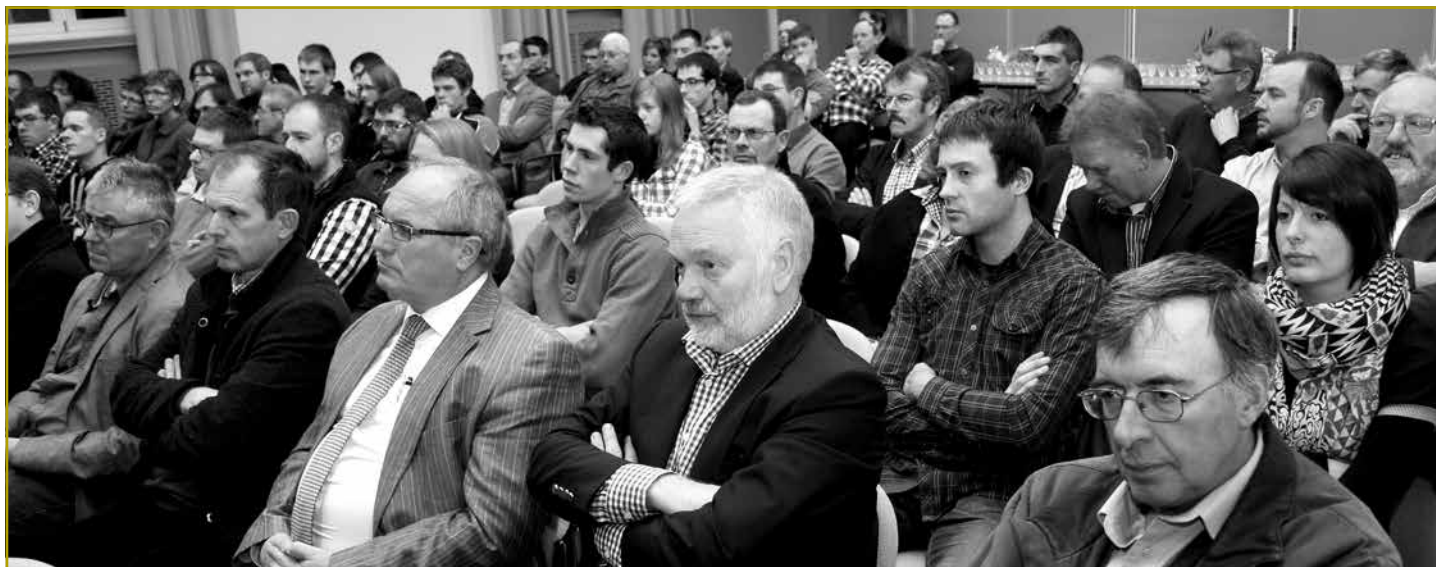
Vill Interessenten haten sech fir de Jongbaueren- a Jongwënzerdag 2013 am Festsall vum LTA afonnt. Bis an déi hënnescht Reien waren d'Plazen all besat