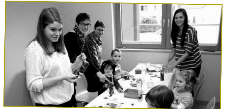
Fir déi Jéngst war e Mol- a Bastelatelier agericht ginn.