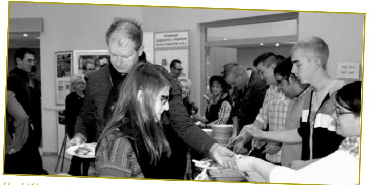
Ueschléissend huet de Grupp op de Concert Apéro mat der Fanfare Concordia Rosport an op d'Mëttegiessen an de Centre polyvalent „Fräihof“ op Steenem invitéiert.