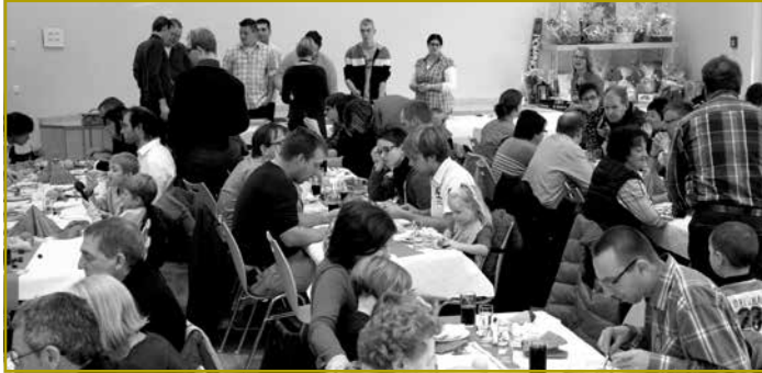
Vill Frënn a Bekannte waren um Rendezvous fir hir Solidaritéit mat der manerbemëttelter Landbevëlkerung an Afrika iwwer dëse Wee zum Ausdröck ze bréngen.