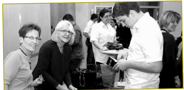
Op de Stänn vun de Boutiques du Monde a vu Partage Afrique goufe Konschtgéiggestänn an lesswueren aus dem fairen Handel ugebueden