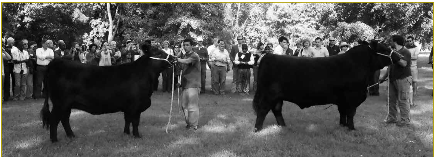
Vorführung von zwei Prachttieren des Betriebes „Cabaña Charles de Guerrero“