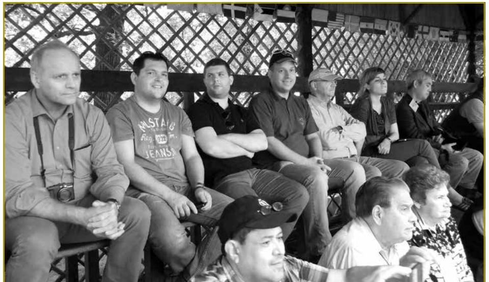
Ein interessiertes Publikum bei der Bullenvorstellung auf der Besamungsstation „La Elise-Ciale“

An die Besamungsstation ist ein landwirtschaftlicher Betrieb mit Milchviehherde und Ackerbau angegliedert. Die Milchviehherde besteht aus 970 Holsteinkühen mit der weiblichen Nachzucht. Sämtliche Tiere sind absolute Spitzentiere. Die Tiere sind das ganze Jahr über auf der Weide. Im Melkstand wird Kraftfutter hinzugefüttert. Im letzten