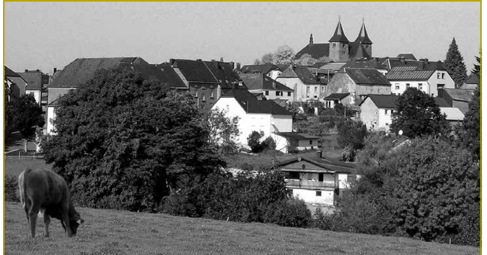
Housen ass prett, fir d'Jugend aus dem Land um 40. Landjugenddag ze begrëssen

A ls Buergermeeschter vun der Gemeng Parc Housen ass et fir mech eng Freed, d'Participanten vum 40. Landjugenddag, den 29. Mee zu Housen am Kulturzentrum begrëssen ze kënnen.