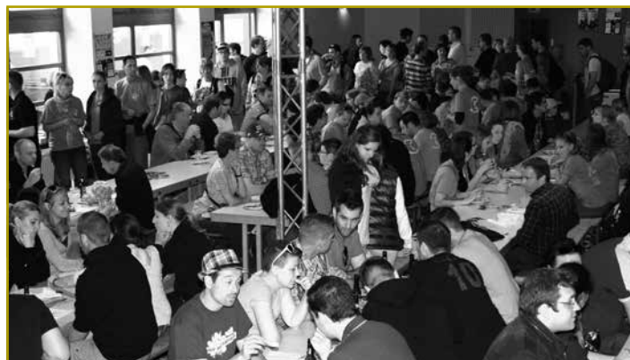
Och déi 40. Editioun vum Landjugenddag war e vollen Erfolleg. Niewent deene ronn 128 Gruppen, déi sech fir de Rallye ageschriwwen haten, ware vill Frënn a Sympathisante vun der Landjugend zu Housen um Rendezvous

méiglechen, fir hir Bébéen a gudde Konditiounen op d'Welt ze bréngen an medezinesch ze versuargen.