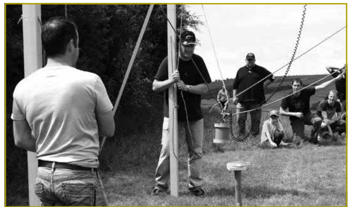
D'Gruppen um 8,5 km laangen Tour, wou et spannend Spiller ze meeschteren a kniwweleg Froenbéi ze léise gouf

Als President vun der Landjugend Furen ass et fir mech eng grouss Éier, lech ganz häerzlech hei am Centre Culturel vun Housen fir de 40. Landjugenddag begrëssen ze kënnen.