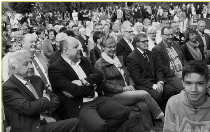
Mam Här Äerzbëschof an a Präsenz vu villen Autoritéiten konnt ënner fräiem Himmel eng beandrockend Jugendmass zum Optakt vum 40. Landjugenddag gefeiert ginn

Su fiert van 8. bis 16. September o e Grupp van eis an de Kamerun, fir sech e Bild van der Kooperatiounsaarbecht ze maachen, déi eis ONG mat de lokale Partner op der Platz realiséiert. Am Moment gëtt zu Soa eng kleng Maternité am Centre de Santé operiicht an equipéiert, fir der grousser Nofro nozekommen, an de Fraen et ze er-