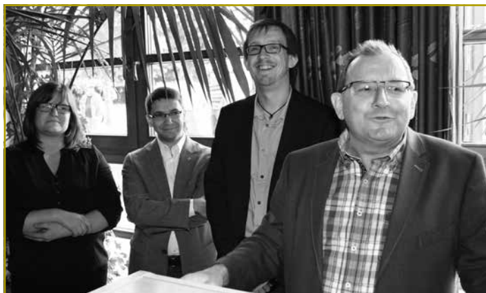
Um Éirewäin huet de Landwirtschaftsminister Fernand Etgen – a Verriedung vun der Regierung – e puer Wuert vu Respekt an Encouragement bei Geleeënheet vum 40. Landjugenddag ausgesproch