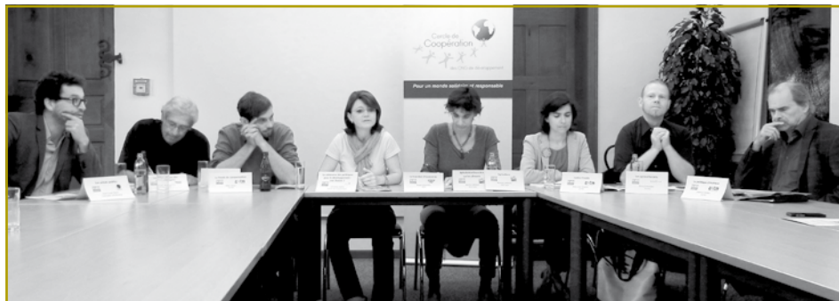
Les coauteurs du 2 ème baromètre „FairPolitics“ lors de la conférence de presse du 1 er octobre 2014

Contrairement à ce que l'on pense souvent, il ne s'agit donc pas de rendre la politique de coopération du Luxembourg cohérente avec les autres politiques, mais - au contraire - de rester vigilant quant à l'impact potentiellement négatif sur le développement de pays et de populations vulnérables, que peuvent avoir des décisions