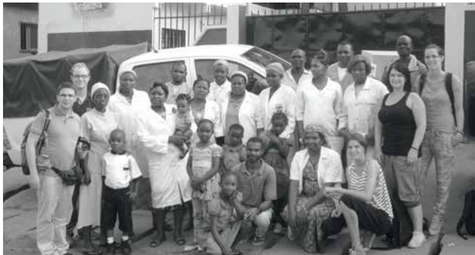
Gruppenbild mit dem Personal der Kranken- und Entbindungsstation in Soa

Unterdessen hatten Arbeiter ein kleines Zelt vor dem Centre de Santé Sainte Marie aufgerichtet. In diesem Zelt wurde alsdann ein Gottesdienst gefeiert an dem wir alle teilnahmen. Der Gottesdienst dauerte ungefähr 2 Stunden, was uns Europäern als unendlich erschien. Anschließend wurde die Entbindungsstation offiziell eingeweiht . Nach der Einweihung lud Schwester Marie Pierrette uns zu einem gemeinsamen feierlichen Essen ein.