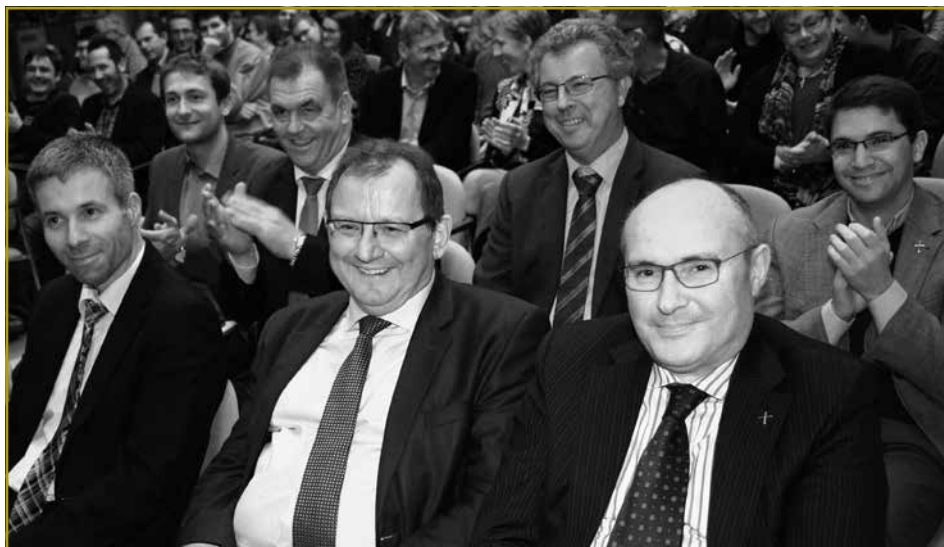
Vill Kritik goufen an der Stellungnahme déi Zoustänneg gericht. Esou munch pickeg Äusserung konnt awer mat engem Schmunzelen opgeholl ginn

d'Virkaftsrecht vum Staat a vun de Gemenge kritiséieren. D'LJB&JW hunn déi lescht Joren op verschidde Plaze gefuerdert, datt eng Regelung vum Landkaf ausgeschafft muss ginn, fir de jonke Baueren den Zougang zum Eegeland ze vereinfachen. Op dëser Plaz hu mir e Virkaftsrecht fir d'Landwirtschaft, eng Steuererleichterung fir de Verkeefer – wann en un den aktive Bauer verkeeft –, oder awer e Modell, wéi de franséische SAFER gefuerdert. Et ass fir äis esou net ze verstoen, datt eis Iddie vun der Partei, déi de Staats- an de Landwirtschaftsminister stellt, zréckgewise goufen, mam Argument, eis Fuerderunge vum Virkaftsrecht géifen zevill an d'Eigentumsrecht eragräifen. An elo – wou si an der Verantwortung sinn – spillt d'Eigentumsrecht iwwerhaapt keng Roll méi...! Wou bleift do nach d'Glawierdegkeet vun eiser Politik?