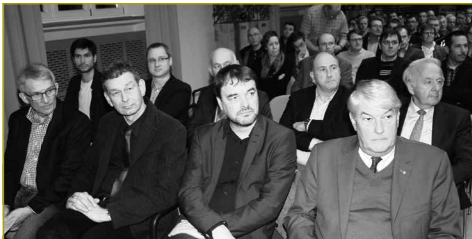
Och déi dësjäreg Editioun vum Jongbaueren- a Jongwënzerdag ass op vill Interessi bei den Akteuren aus der Landwirtschaft gestouss

a Beispiller vun äis, wou dringend muss nogebessert ginn, fir datt d'Landwirtschaft – a virun allem déi jonk Baueren – an hirer Entwécklung ënnerstëtzt ginn an kee Schued dovun droen: