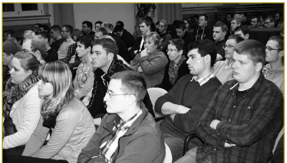
Niewent den Ancienë konnten op en Neits vill Jonker vun den Associatiounen vun der LLJ – JB & JW um Owend gezielt ginn

Zum Schluss wëlle mir nach emol betounen, datt déi Fuerderungen an Iwwerleeungen – déi mir elo virbruecht hunn – guer net aus der Loft gegraff, mee absolut néideg sinn, fir datt jonk Leit sech widerhin op hire Familljebetriber néierloossen. Mir maachen een Opruff un lech, Här Minister, ze handelen an eis Fuerderungen an der Regierung virunzebréngen, fir datt déi jonk Baueren erkennen, datt si och an Zukunft nach hei am Land gebraucht ginn!