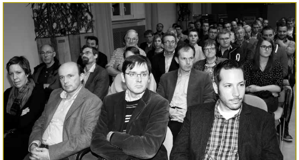
De Bléck an de gutt gefüllte Festsall vum LTA bezeit, datt d'Themen, déi um Jongbaueren- a Jongwënzerdag ugeschnidde ginn, ëmmer nees op groussen Interessé bei den Akteuren aus der Landwirtschaft stoussen

Ech si sécher, datt och dëse Jongbaueren- a Jongwënzerdag dovunner een Ausdröck wäert sinn an ech felicitéieren lech dozou a wënschen der Versammlung e gudde Verlaf. Ech soen lech Merci.