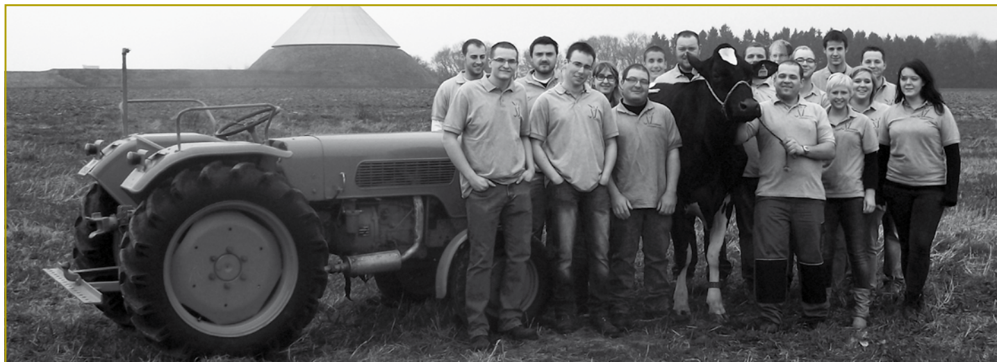
Den Organisatiounscomité freet sech fir d'Jugend vum Land zu Gamech an Héiweng ze ëmfänken