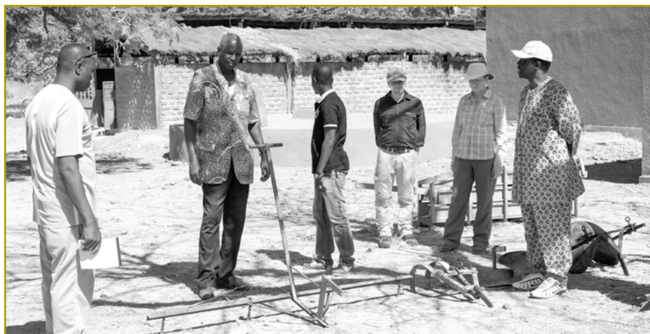
Besichtigung des CTAA und Begutachtung des verfügbaren Materials anlässlich der diesjährigen „Visite de suivi“, die vom 31. Januar bis 10. Februar 2015 von den Vertretern unserer NRO durchgeführt wurde

meinde Barga die Dörfer Derhogo, Dinguiri und Kerga mit 8.845 Einwohnern und bei Tiogo in der Gemeinde Tenado die Dörfer Bavila, Bow, Tialgo, Tio und Tio Mouhoun mit insgesamt 12.994 Einwohnern, die an dem Programm teilnehmen werden.