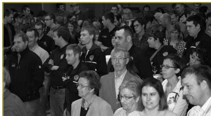
Och de Minister Claude Meisch huet de Verantwortlechen an de Memberen aus de Verbänn vun der Lëtzebuurger Landjugend – Jongbaueren a Jongwënzer e grouse Luef ausgeschat, fir hir Initiativen an hiren Asaz hei zu Lëtzebuerg an am Kader vun der Kooperatiounsarbecht an Afrika