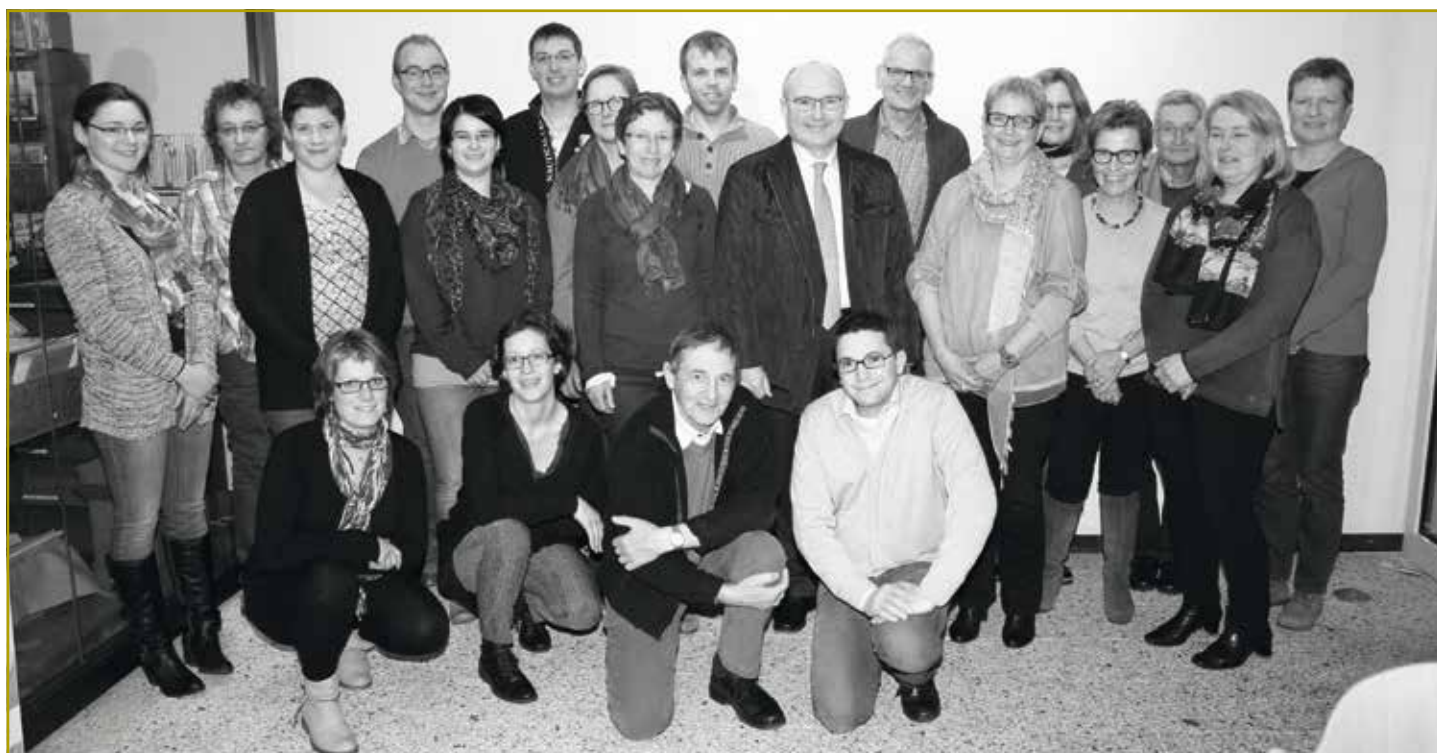
En Deel vun de Membere vun der ONG a vum Verwaltungsrat bei Geleeënheet vun der uerdentlecher Generalversammlung, déi den 30. Mäerz 2015 an de Raimlechteete vun der ErwuesseBildung am Centre Convict ofgehal gouf