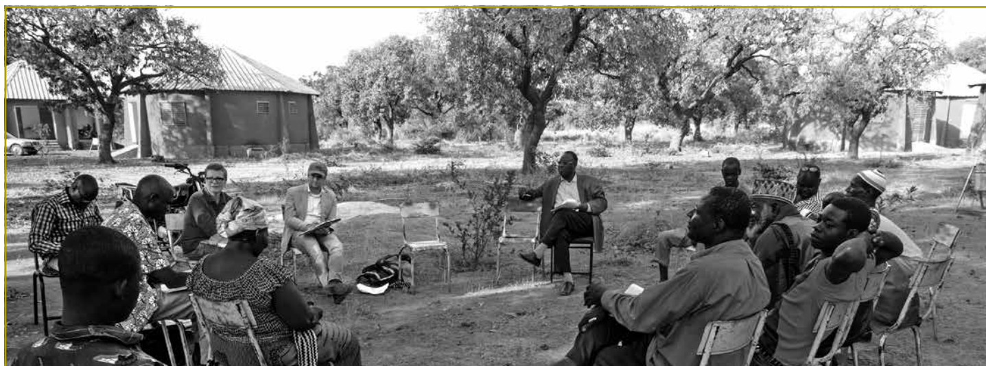
Lors des dernières réunions du CPS en février 2015, deux axes prioritaires pour l'année en cours ont été déterminées ensemble avec le partenaire local, les CVD des 4 villages pilotes partenaires du Centre et l'équipe du CTAA

Le succès des formations du CTAA a aussi un impact direct sur la diffusion et la fabrication du porte-outil Kassine (développé et promu par Prommata). Avec les 122 Kassines récemment commandées par SOS Sahel Burkina, nos propres 100 Kassines, et d'autres commandes importantes en prévision, Prommata a décidé de mettre en place une convention avec les artisans qui ont été formés à la fabrication de la Kassine. Cette convention a pour but de garantir une qualité homogène du matériel fabriqué, et un prix de vente uniforme et équitable, afin de ne pas porter atteinte à l'image du produit. Une telle convention permettra aussi aux fabricants agréés de répondre aux futurs appels d'offre du gouvernement burkinabé. Cependant, cette