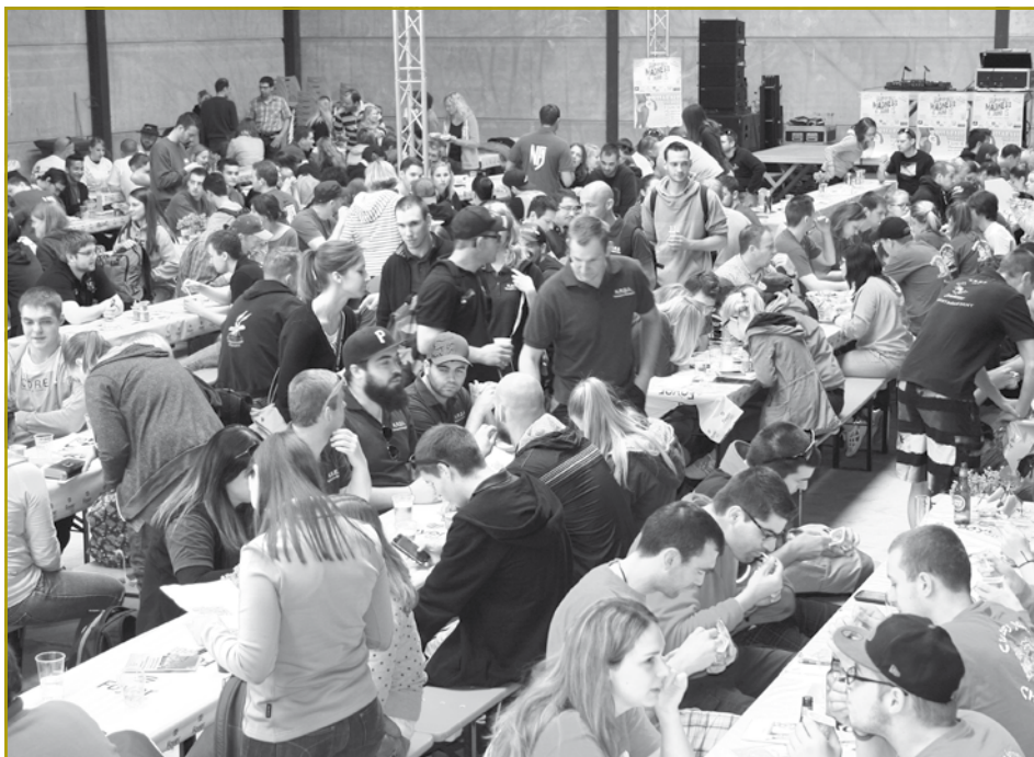
Och den 41. Landjugenddag war e grouse Succès. Vill weider Fotoe fënnt deen Interesséierten ënner www.jongbaueren.lu

Lëtzebuurger Jongbaueren a Jongwënzer – Service Coopération a.s.b.l.