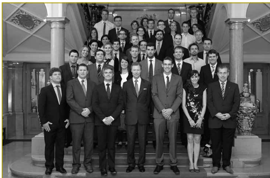
Zum Auftakt des CEJA-Seminars hatten die Vertreter der europäischen Jungbauervereinigungen am 1. Juli 2015 die große Ehre zur Audienz von Großherzog Henri empfangen zu werden

Lassen Sie mich jetzt aber von der heutigen Konferenz sprechen: „Empowering young farmers – A pillar of Europe 2050“. Ich denke, dass dieser Titel sehr passend ist. Wenn wir die Zukunft Europas auf eine nachhaltige Weise aufbauen wollen, muss den heutigen Junglandwirten eine maßgebliche Rolle zuteilwerden! Die Herausforderungen, denen Europa und insbesondere der Agrarsektor gegenüberstehen, sind enorm: