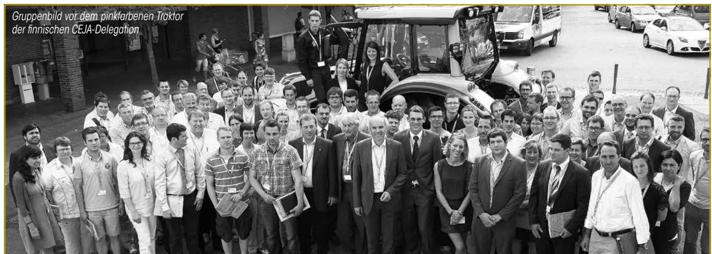
Gruppenbild vor dem pinkfarbenen Traktor der finnischen CEJA-Delegation

Viele weitere Fotos des dreitägigen CEJA-Seminars findet der Interessierte unter www.jongbaueren.lu