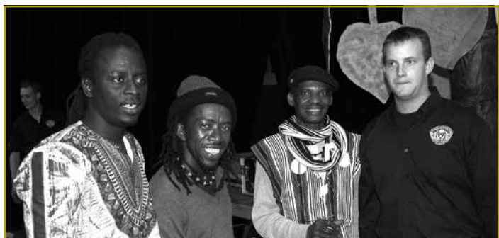
Fir déi richtig afrikanesch Stëmmung hunn d’Museker vum Grupp „Black Djembé“ gesuergt