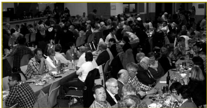
„Full house“ am Hall polyvalent zu Klierf!