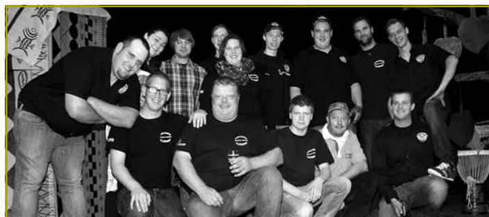
De Landjugendgrupp ka mat Stolz op säin 1. Dag vun der Kooperatioun zrëckblécken. Si hunn alles ginn, fir datt et e Succès konnt ginn