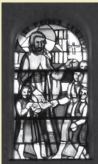
(Kirchenfenster: P. Canisius, Pfarrkirche Liesing, Wien)

Aus einem Gebet von Petrus Canisius, Kirchenlehrer, SJ, 1521-1597, zum Heiligsten Herzen Jesu