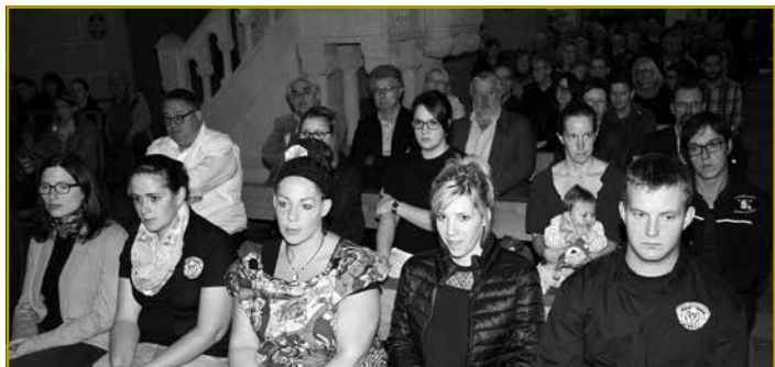
Och zu Klierf hunn déi Jonk aus dem regionale Grupp vum eise Verbänn drop gehalen, fir hir Frënn a Sympathisanten zum Optakt vum traditionellen Dag zugonschte vun der Kooperatiounsaarbecht an d’Mass an d’Porkierch anzueluden

Vill weider Fotoen ënnen: www.jongbaueren.lu