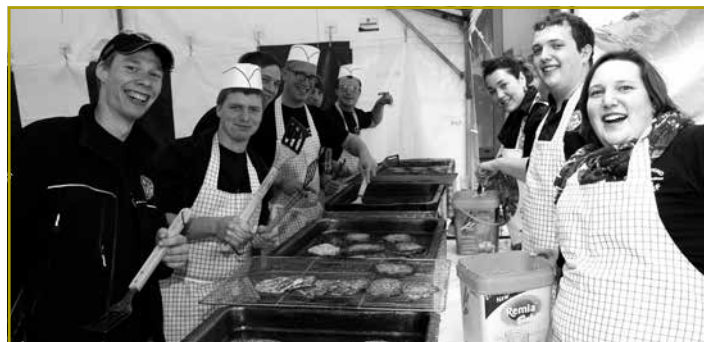
Gutt Stëmmung am Kichenzelt obschonn datt richtig vill Aarbecht ugesot war, fir d’Gäschtfreiden ze stellen