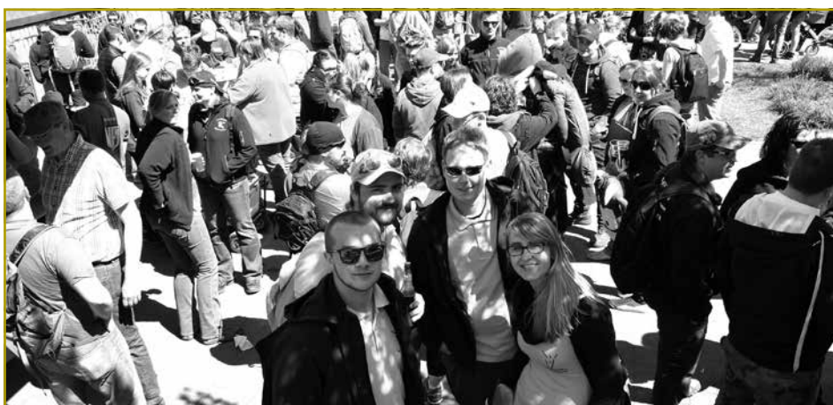
Och den 42. Landjugenddag war e grouse Succès. Vill jonk Leit hunn sech et net entgoe gelooss, fir e puer flott Stonne bei beschtem sonnege Wieder zu Biekerech ze verbréngen...