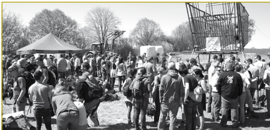
... a sech bei de flotte Spiller, déi déi Verantwortlech vun der Landjugend Zenter fir si preparéiert haten, auszutoben an ze amüséieren