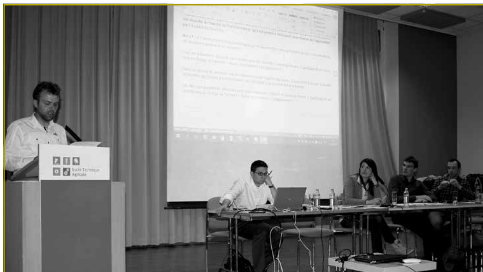
Mat grousser Geschéck huet de Remy duerch den Owend gefouert, esou datt déi geplangte Statutenännerung virgeholl konnte ginn

Op den dësjärege Generalversammlung vun der Associatioun vun der Lëtzebuurger Landjugend – Jongbaueren a Jongwënzer, déi de 15. Abrëll 2016 am Festsall vum Lycée Technique Agricole