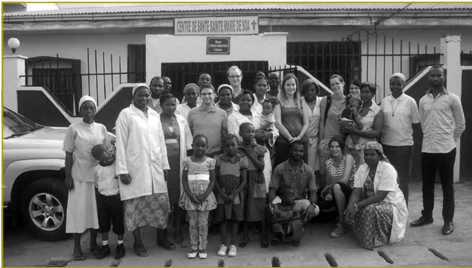
Visite vum Centre de santé vu Soa vu Membere vun der Lëtzeburger Landjugend a Jongbaueren am Joer 2014

Zënter laange Jore gehéiert déi lokal Schwëstere-Communautéit vun de Soeurs de Sainte Marie vu Soa am Kamerun zu de Partner vun der ONG. Esou gouf beispillsweis zu Soa an de Joren 2011, resp. 2012 – an zwou Etappen – en Dispensaire ausgebaut an equipéiert, fir der grousser Demande vun der Bevëlkerung nozekommen, fir hir medezinesch Versuerung ze garantéieren.