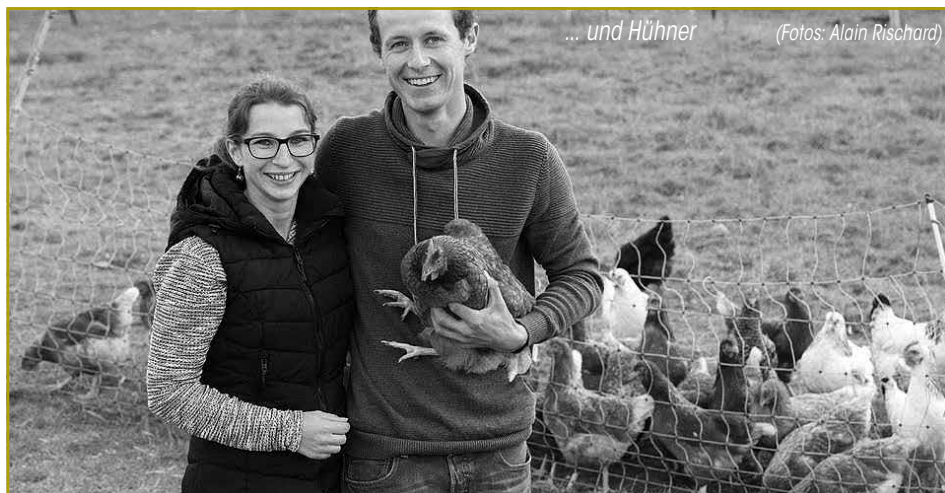
... und Hühner

mand den Job gern macht. Familie und Betrieb - das ging immer ineinander über, da gab es keine starre Grenze. Ich hatte stets Kontakt zu meinen Eltern. Manchmal habe ich draußen gespielt, dann geholfen, dann weitergemacht. Das hat Spaß gemacht. Die Familie und der Betrieb sind eng miteinander verzahnt. Leider verschwindet das.