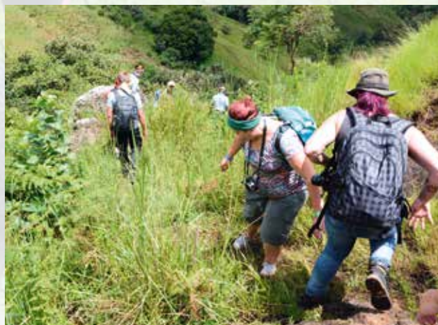
Wanderung am Reebësch bei Jakiri