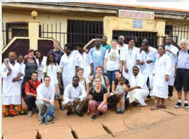
De Grupp zesumme mat der Equipe vun der Maternité