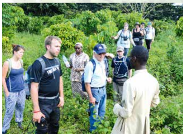
Visite vun der Kakaosplantage zu Nden