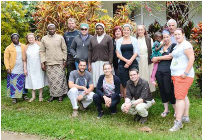
D'Géigewaart erliewen - hei mat Frënn am Kamerun