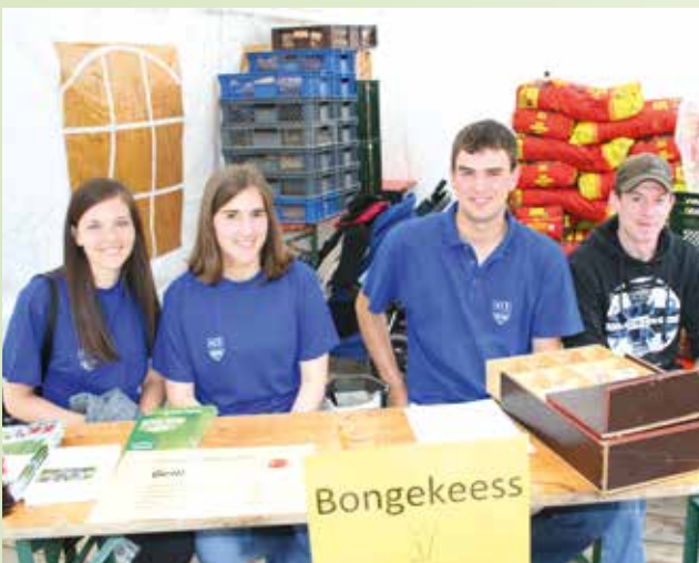
Siefert an der Keess oder op den Iess- a Gedrénksstänn, déi Jonk waren op dee groussen Undrang vun de Visiteure preparéiert