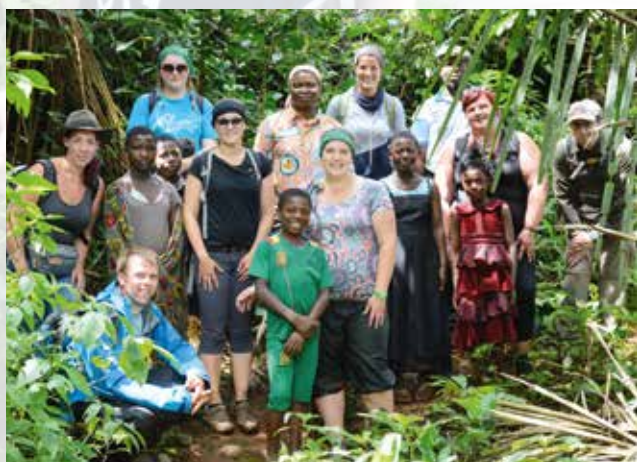
„Familljefoto“ am Reebësch mat de jonke Guiden