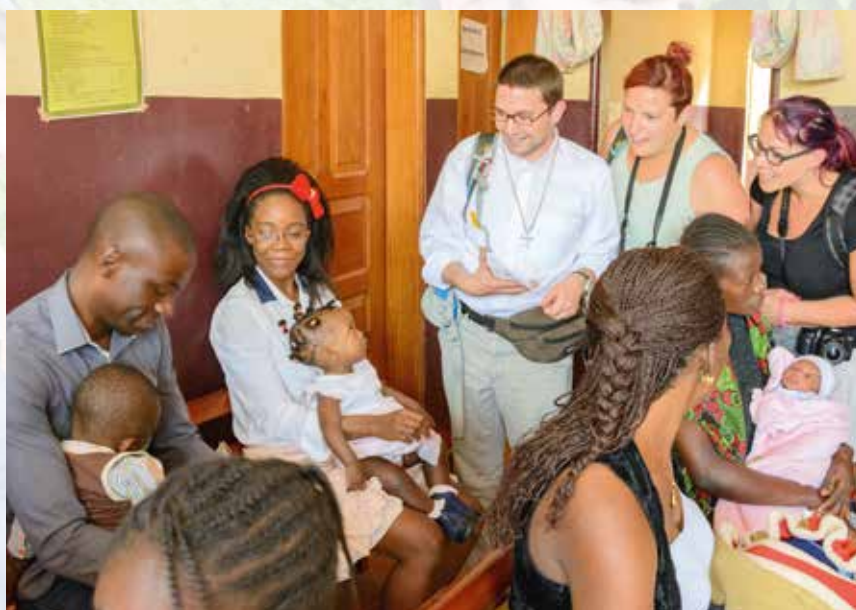
Gespréich a kleng Kaddo fir dee jonken Israel

Service Coopération vun der LLJ (ONG), hunn sech de 26. August 2016 an de Kamerun op de Wee gemaach, fir engersäits de Kooperatiounsprojet vun der ONG „Maternité vu Soa“ an awer och d'Land an d'Leit – an deem d'ONG zënter laange Joren aktiv ass – kennenzeléieren.