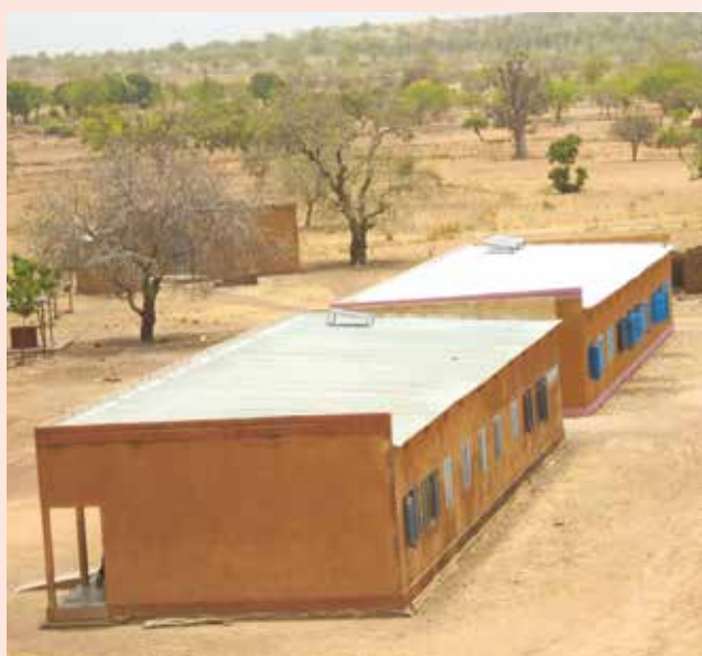
L'école primaire de Zambélé

Le Burkina Faso est un des pays les plus pauvres du monde, classé au 183 ème rang sur 188 au niveau de l'indice de développement humain (PNUD 2015). Le pays se caractérise par une population jeune (la moitié de la population a moins de 15 ans), très faiblement urbanisée (80% de la population vit en milieu rural), et dont le taux d'alphabétisation atteint seulement 29% (PNUD 2014). L'analphabétisme constitue un frein majeur au développement et confine la population dans l'extrême pauvreté. Malgré les efforts du gouvernement burkinabè et de ses partenaires internationaux, le taux de scolarisation reste toujours en dessous des normes souhaitées et les infrastructures scolaires sont largement insuffisantes, en particulier en milieu rural.