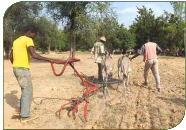
Démonstration du zai mécanisé avec un attelage asin et une kassine équipée d'un trident, à Sam en octobre 2014

l'agriculture familiale représente une part importante du travail de LLJ-SC au Burkina Faso. En effet, l'utilisation des ânes de traits (animal modeste, facile d'entretien, et à faible coût d'achat) dans les exploitations familiales les plus pauvres permet de remplacer le travail à la main, de réduire la pénibilité du travail, de gagner du temps dans la