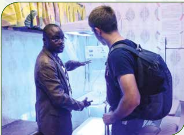
Explikatiounen zu der „Table de foetothérapie“ an de Couveusen, déi duerch déi generéis Ënnerstëtzung vun eisen Donateuren ugeschafft konnt ginn

Den nächste Mueren hu mir dovun profitéiert, fir bei enger fantastescher Aussicht an enger Gespréichsronn iwwert eis éischt Andréck ze schwätzen. Déi laang Zäit am Auto an de Stress haten op d'Gemitt an d'Moral geschloen.