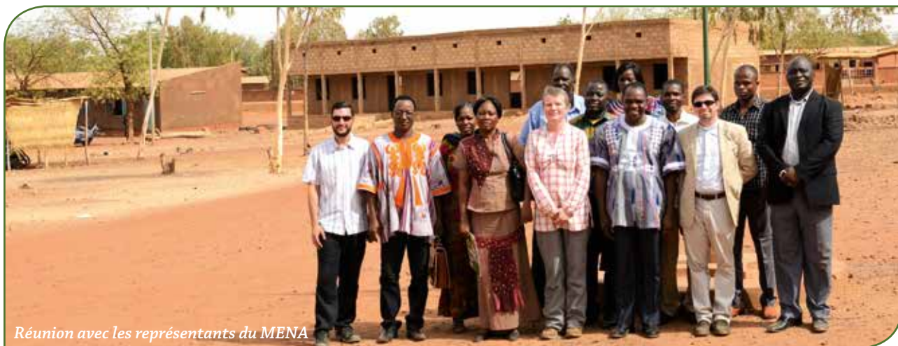
Réunion avec les représentants du MENA

effet, les CVD des 4 villages-pilotes (Imasgo, Tiogo, Sabouna, Koalma) se sont toujours montrés très dynamiques et engagés, et représentent une bonne opportunité pour recentrer notre action sur les populations bénéficiaires. La coordination de ce nouveau projet a été confiée à la Fédération des Professionnels Agricoles du Burkina (FEPAB). Créée en 1997, et membre de la Confédération Paysanne du Faso (CPF), la FEPAB est reconnue au niveau national et très présente sur le terrain à travers ses activités d'appui-conseil aux producteurs. Plusieurs réunions ont été organisées avec la FEPAB et les CVD pour préparer ensemble le plan d'action de ce futur projet. A l'issue de ces réunions il a également été décidé de réaliser une étude préalable afin de mieux appréhender les besoins réels et les activités à mener, mais aussi d'établir une situation de référence pour mieux mesurer les objectifs à atteindre. Enfin, une rencontre a été organisée avec le Ministre de l'agriculture, M. Jacob Ouédraogo, pour s'assurer de l'alignement du nouveau projet avec le programme de développement national et de l'accompagnement des autorités.