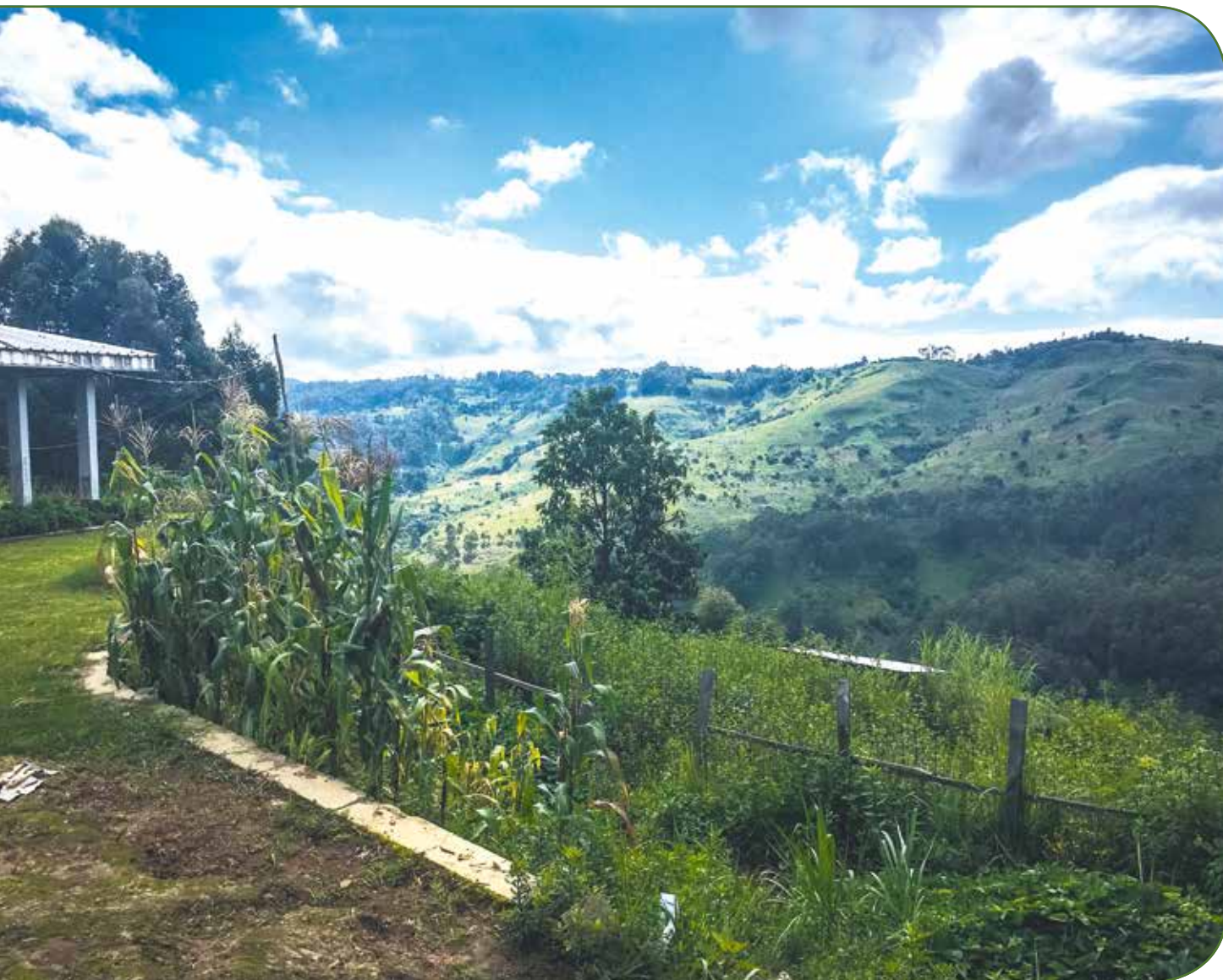
Och déi beandrockend Naturlandschaften haten hinnen et ugedoen

De Sonndegmueren huet ganz fréi ugefaange well mir all zesummen an d'Mass wollte goen. Während dëser schéiner Mass hat dann och jiddereen eng Stonn Zäit, sech seng eege Gedanken – an d'Bekanntschaft vum Duerfhond Sandy – ze maachen. Dono krute mir natierlech och déi ganz Ariichtung vum Dispensaire gewisen. Et huet äis un d'Nodenke bruecht, ënnert wéi enge Bedéngungen d'Leit do ënnerbruecht ginn, well et awer u ville Saache feelt an alles ofgenotzt ass. Trotzdeem maachen déi Verantwortlech vum Dispensaire dat Bescht draus a probéieren de Patienten esou gutt, ewéi méiglech ze hëllefen.