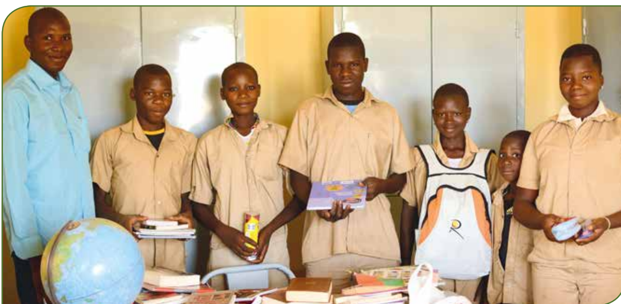
Remise du matériel et des livres collectés par les élèves du Lycée Classique d'Echternach

En parallèle, un nouveau projet de promotion de la traction asine a été identifié en travaillant directement à partir des villages-pilotes et en utilisant les ressources (maison-relais, opération « 100 kassines ») et les capacités (formateurs-relais) qui avaient été mises à leur disposition entre 2014 et 2016 pour former d'autres villages dans leurs régions respectives et agrandir considérablement leur rayon d'action. En