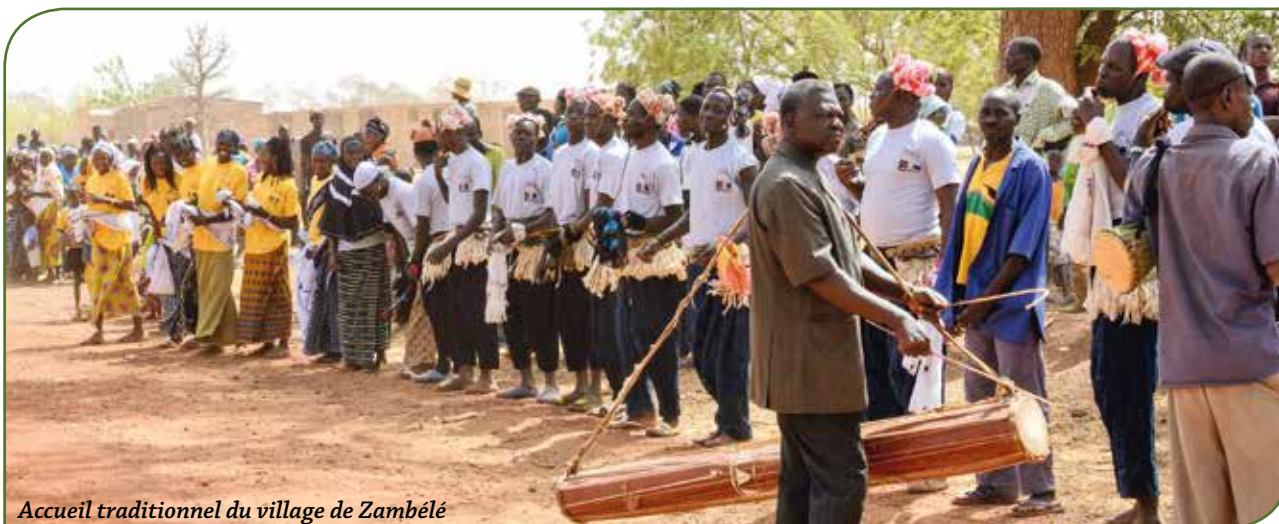
Accueil traditionnel du village de Zambélé

Dans le cadre du suivi des projets, une petite équipe du Service Coopération s'est rendue sur le terrain du 11 au 18 mars 2017. Cette année, la visite était un peu particulière car elle coïncidait avec la mise en place de nouvelles orientations prises dans le cadre du projet CTAA – Centre Technique d'Amélioration de la traction Asine. Ces changements ont été réalisés dans le but de s'adapter à l'évolution de la situation politique-économique-environnementale du Burkina Faso, mais également d'amorcer l'autonomisation du CTAA.