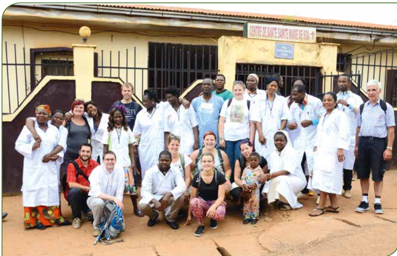
Um éischten Dag vun der sougenannter Kooperationsrees stoung d'Visite vum Dispensaire an der klenger Maternité vu Soa um Programm

Um éischten Dag stoung d'Visite vum Projet um Programm, dee vun der lokaler Schwësteregemeinschaft vun de Soeurs de Sainte Marie mat der Ënnerstëtzung vun eiser ONG realiséiert gouf: d'Maternité vu Soa. Nom kommunikativen Austausch mat Dokteren an Infirmière konnte mir äis selwer e Bild vun hirer aldeeglecher