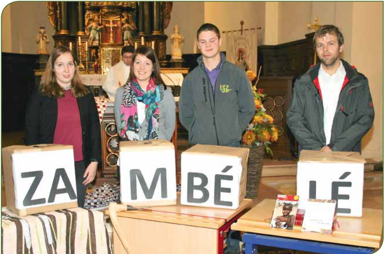
ZAMBÉLÉ – dës puer Buschtawen sinn e Symbol fir Bildung

net aus Gold an Diamanten, mee et ass d'Bildung, déi zentral ass. Wa Kanner a Jonker (an natierlech och Erwuessener) eng gutt Bildung erliewe kënnen, da sinn se gestärkt op hirem Liewenswee. Se kréien d'Méiglechkeet, fir sech, hir Familljen, hir Ëmwelt, eng besser Zukunft opzebauen. Eng Schoul bauen, an d'Bildung investéieren, Mënschen eng Bildung garantéieren, all dat heescht Zukunft opbauen.