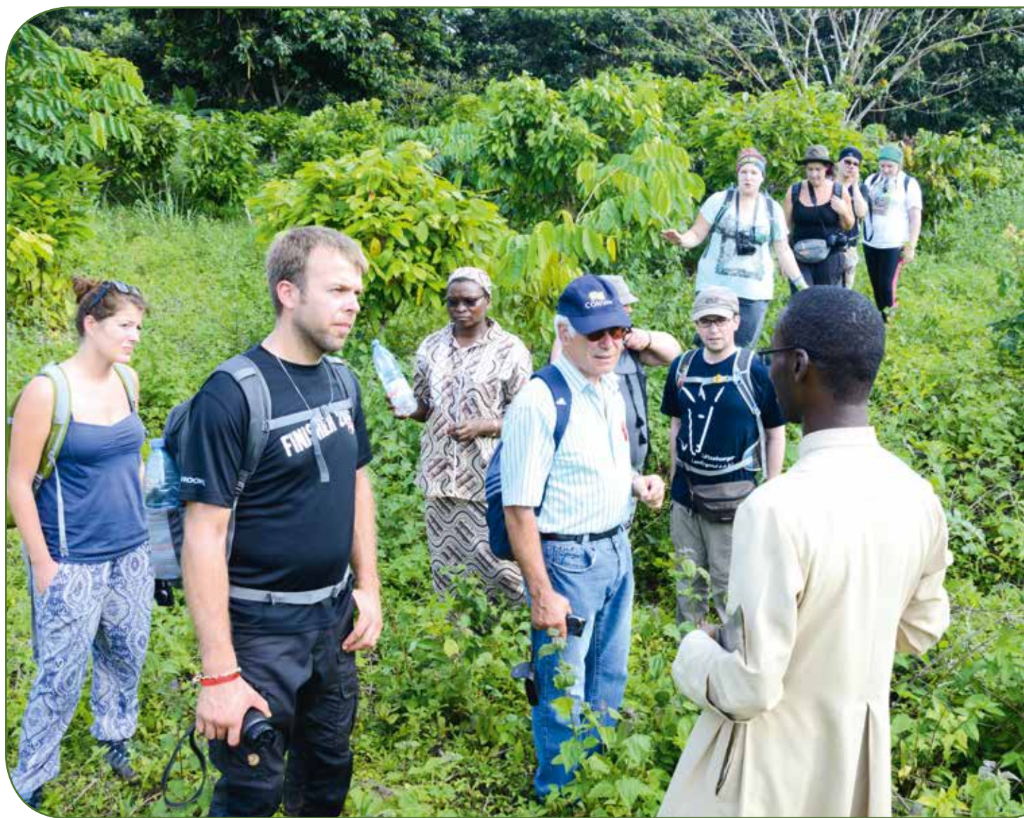
Zu Nden huet e Pater d'Lëtzebuenger mat dem Schaffen an de Kakaosplantagé vertraut gemaach