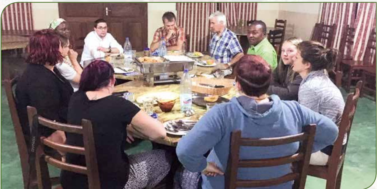
Déi jonk Leit sinn ëmmer nees dovun iwwerzeegt ginn, datt d'Gaaschtfrëndschaft am Kamerun héich gehale gëtt

Den Dag drop goug et ganz fréi - leider ouni Kaffi – eraus, fir um Wee fir op Yaoundé nach kënnen e Stopp bei engem weidere Waasserfall ze maachen. Kaffi gouf et du schlussendlech bei engem anere Bëschof, bei deem mir