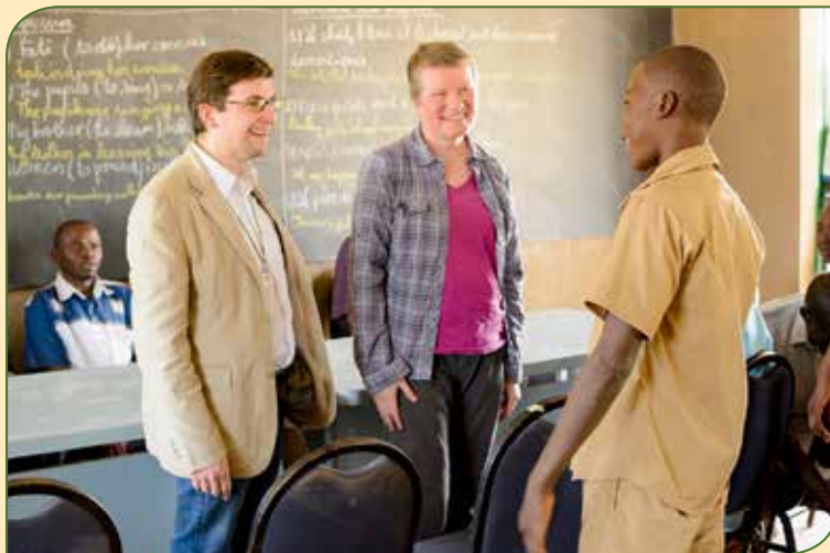
Sech fir eng ONG engagéieren, bedeit ëmmer Mënsche begéinen a mat hinnen e Wee goen

En zentraalt Thema an eisem Wierken ass d'Sensibilisatioun. Et ass äis wichteg, datt wa mer vun engem Projet schwätzen, datt net nëmmen déi materiell Dimensioun beschwat gëtt, mä datt mer ëmmer d'Mënschen an de Mëttelpunkt stellen. Sech fir eng ONG engagéieren (egal op wellechem Niveau) bedeit ëmmer Mënsche begéinen a mat hinnen e Wee goen. Am Beräich vun der Sensibilisatioun publizéiere mer dës Zeitung, den ONG-News, a mer sinn och präsent am LLJ-News, der neier Zeitung vun der Lëtzebuerger Landjugend a Jongbaueren. Mir sinn awer och op ville Plaze präsent, wéi ënnert anerem op der Foire agricole zu Ettelbréck oder um Landjugenddag. De Kooperatiounsdag ass e weidert wichtegt Element an eisem Schaffen. E Grupp vu Studente vun der Sacred Heart University Luxembourg huet sech an enger Aarbecht mat dem Volet vun der Sensibilisatioun vun eiser ONG beschäftegt an äis nei méiglech Weeër an Iddie gewisen. Mir soen hinne Merci fir hir Hëllef a wënschen hinnen all Guddes op hirem weidere Wee.