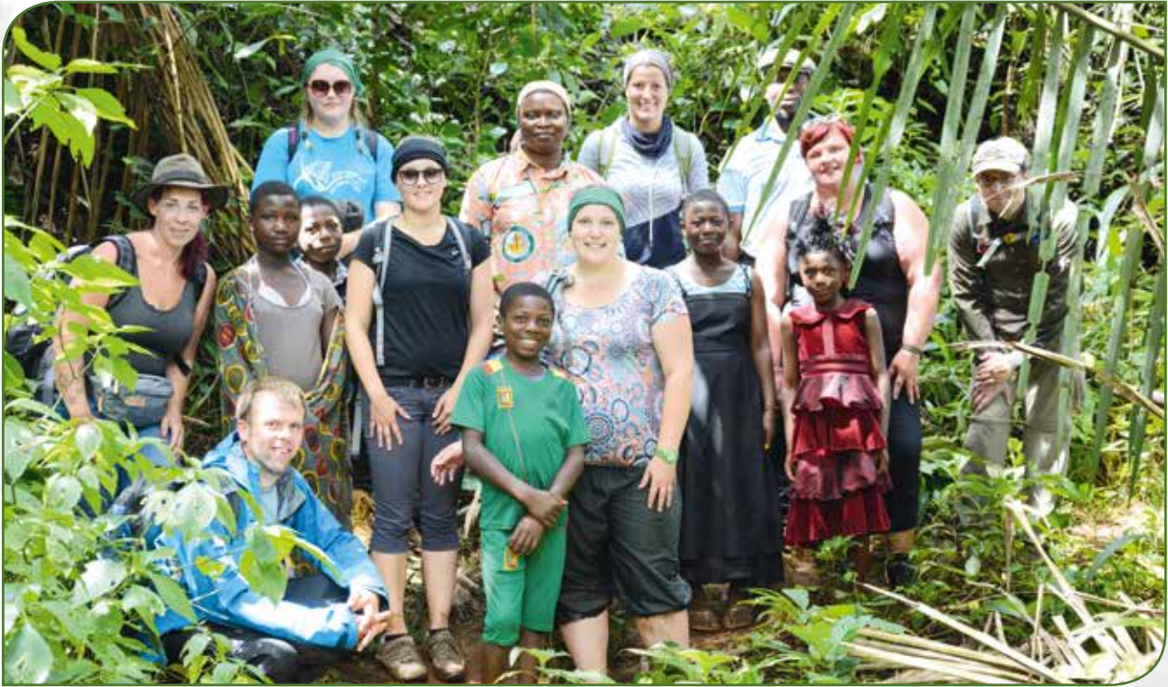
De Grupp um Tour duerch de Reebësch

D'Stëmmung war allerdeings erëm séier besser nodeems mir mat Duerfkanner iwwert en hiwwelege Wee bei e Waasserfall gewandert sinn. An der Grott ukomm, hu Verschiddener sech et och net huele gelooss, fir sech eng kleng Dusch ënnert dem Waasserfall ze gënnen.