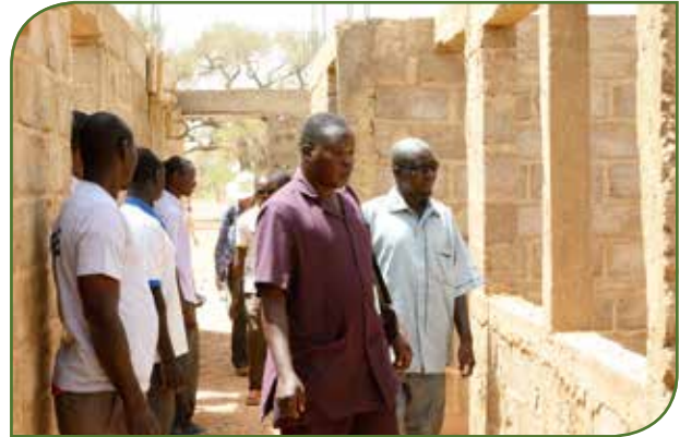
März 2017: Festliche Begrüßung der Vertreter unserer NRO durch die Bevölkerung von Zambélé und den lokalen Autoritäten und gemeinsamer Besuch der neuen Baustelle

In der letzten Ausgabe dieses Blattes (ONG-News Nr. 19/2016, Seite 14 -15) wiesen wir darauf hin, dass die dynamischen Mitglieder des Comité Villageois de Développement (CVD) von Zambélé - im Anschluss an die realisierten Ausbauarbeiten an der Grundschule (2015 - 2016) – weitere Initiativen betreffend die lokalen Schulinfrastrukturen ins Auge gefasst haben. Inzwischen ist diese 2. Phase, wo weitere umfangreiche Arbeiten am sogenannten Schulkomplex von Zambélé vorgesehen sind, in die Wege geleitet worden.