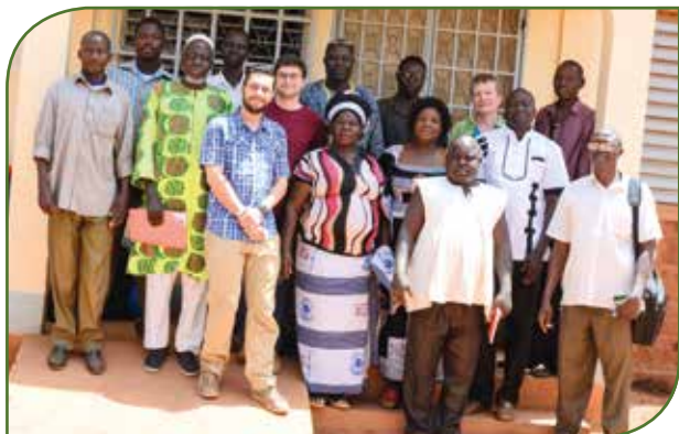
Réunions avec la FEPAB et les CVD des villages-pilotes