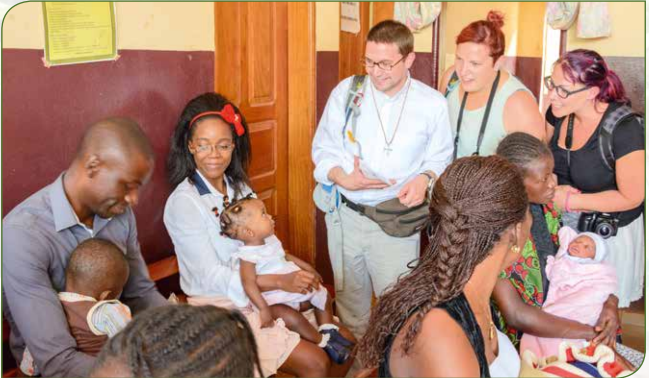
Sympathescht Treffe mat jonken Elteren an der Salle d'attente vun der Maternité

Aarbechtsplaz an de Bedéngungen an der Maternité, maachen. No engem ergräifenden Temoignage vun enger Mamm, där hire Jong no enger Fréigebuert duerch d'Hëllef vun de Couveusë konnt opgepäppelt ginn a gesond opgewuess ass, huet sech och d'Geleeënheet erginn, fir Fraen ze begéinen – déi grad accouchéiert haten – an hinnen e kleng Kado ze iwwerrechen.