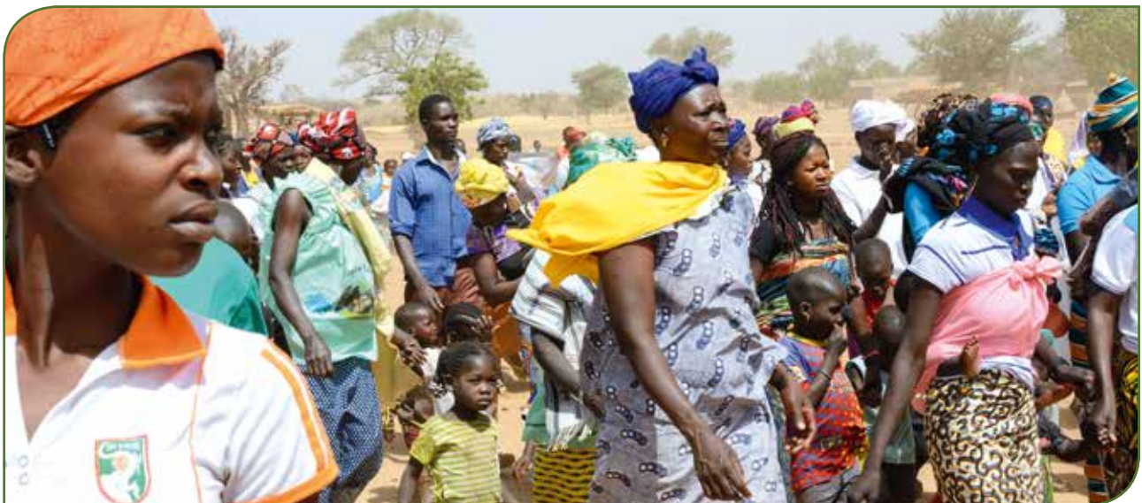
Großes Treffen der Bevölkerung von Zambélé ...