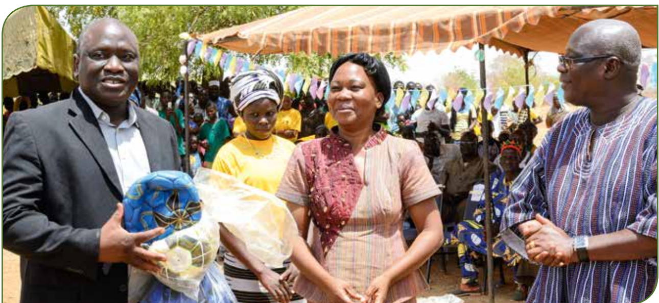
Sympathische Geste anlässlich der offiziellen Einweihung des Collège d'Enseignement Général (CEG): Die Vertreter der Regierung und des Ministeriums des nationalen Bildungswesens hatten Fußballbälle und Trikots für die Schulkinder im Gepäck

Das Projekt beinhaltet des Weiteren, die Ausstattung der Schulklassen und des Bürogebäudes mit den nötigen Möbeln, dem Büro- und dem pädagogischen Arbeitsmaterial.