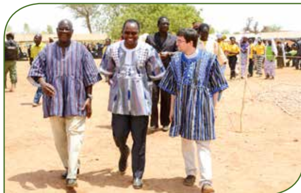
Les représentants du gouvernement, du MENA et de LLJ-SC