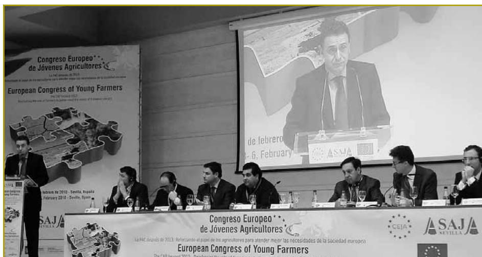
Der CEJA-Kongress fand im Rahmen der spanischen EU-Ratspräsidentschaft statt und wurde vom spanischen Jungbauernverband ASAJA organisiert